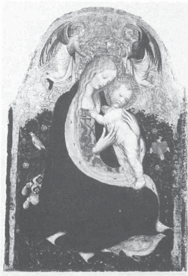
Antonio Pisanello, Madona s prepelicom , Verona / Antonio Pisanello, Madonna with quail , Verona

The exhibition in the Veronese Museo del Campo (open until 8th December, 1996) introduces works of an artist that used to work at the courts of the northern (Mantova, Verona) and southern parts (Napoli) of the Italian peninsula. Antonio di Puccio di Giovanni da Cerreto was also known by a painter's nickname Pisanello. In a capillary manner, by way of recognizable legends, the exhibition extends into other places of the late international gothic in Veneto. It presents artist's paintings ("Madonna della quaglia", "Storia di San Giorgio"), numerous drawings (for the greatest part borrowed from the Louvre Museum in Paris) and medal pieces, for which Pisanello has been generally acknowledged before.