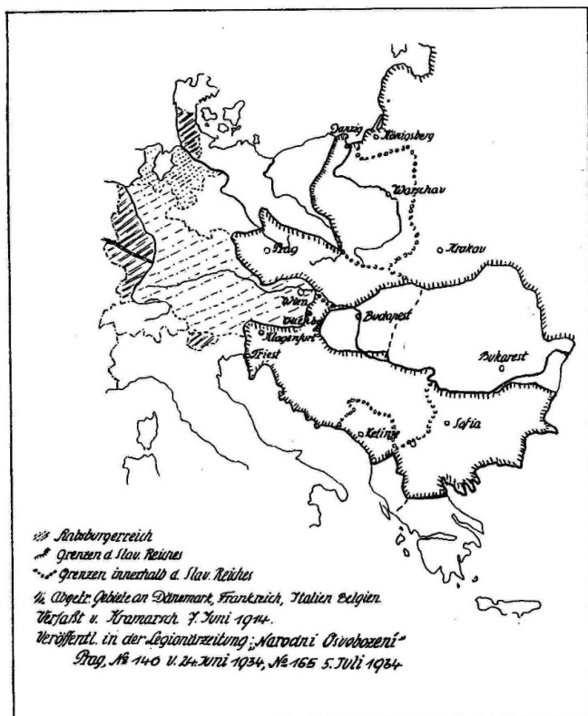
Karte des Slawischen Reiches von Kramarsch.