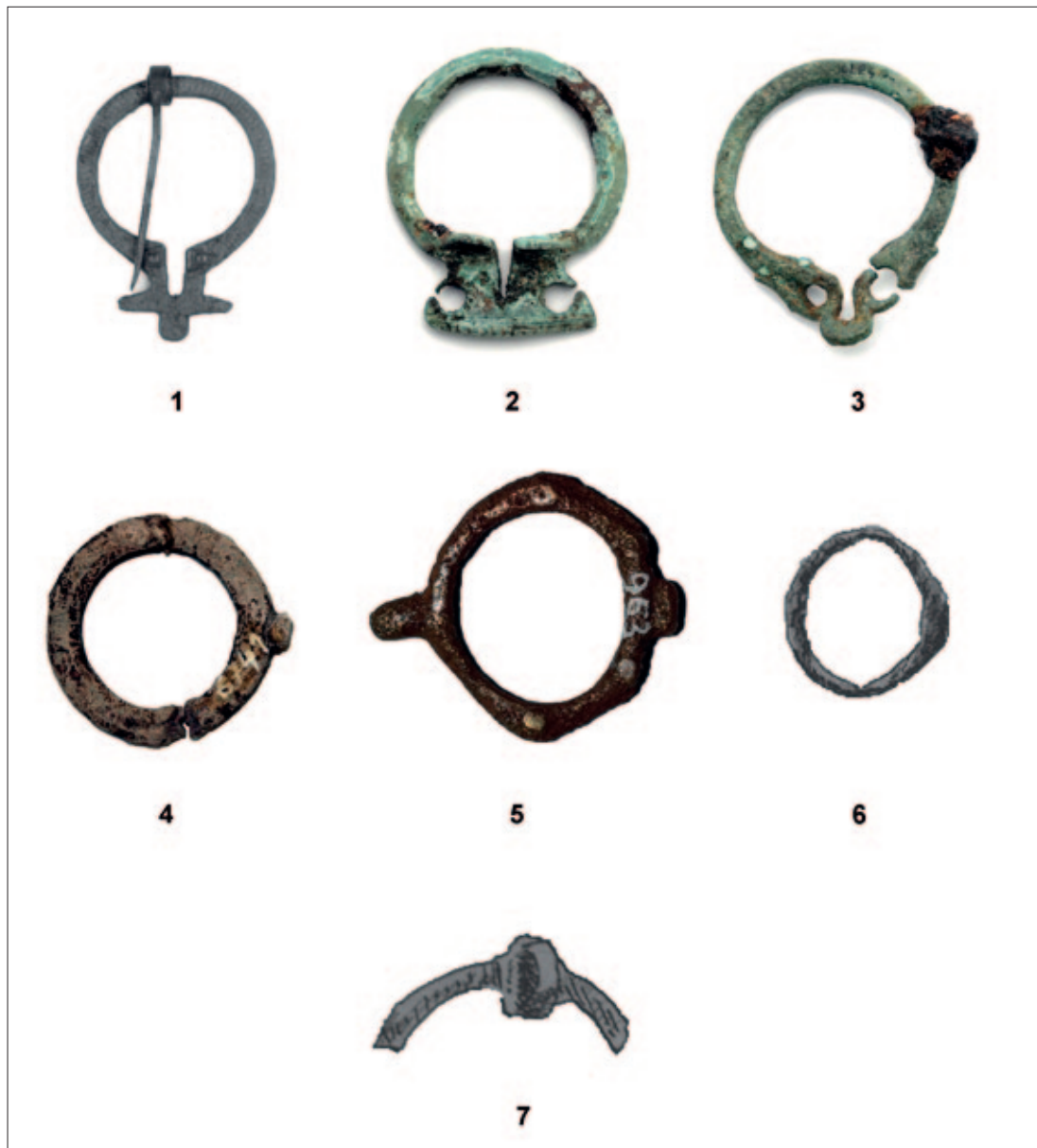
Sl. 12 1 Konjic – Bjelimići; 2–3 Japra – Majdanište; 4 Doboј – Castrum, 5 nepoznato; 6 Sarajevo – Ilidža; 7 Čapljina – Višići