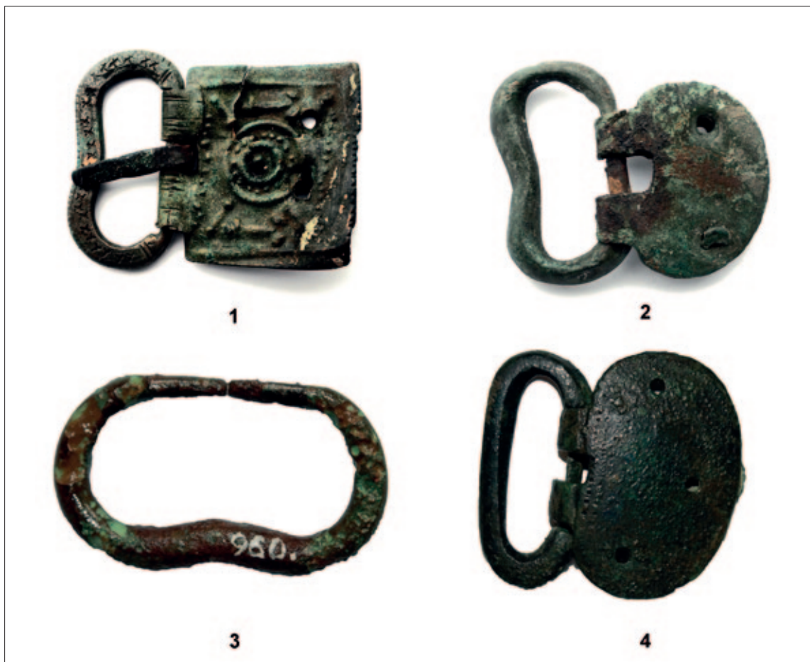
Sl. 5 1 Ljubuški – Gorica; 2 Donja Ivanjska – Glodina; 3–4 nepoznato Fig. 5 1 Ljubuški – Gorica; 2 Donja Ivanjska – Glodina; 3–4 unknown

This variant, which is very similar to variant 2, is represented by two specimens with a thin frame. On one the bar was cast as a piece with the frame (Fig. 4: 6). These were probably of local manufacture and of purely utilitarian use. Similar simple shapes of late Antique provenance have been found in Hispania (Aurrecochea Fernández 1999a: 170, Fig. 11), Vindonissa (Unz, Deschler-Erb 1997: T. 67: 1925), Ptuj (Mikl Curk 1997: 183, Fig. 1: 3) and elsewhere (Koch 2017: T. 4: 12–13). Similar specimens with a double bar have been recorded in north Africa (Boube-Piccot 1994: Pl. 17: 176–177).