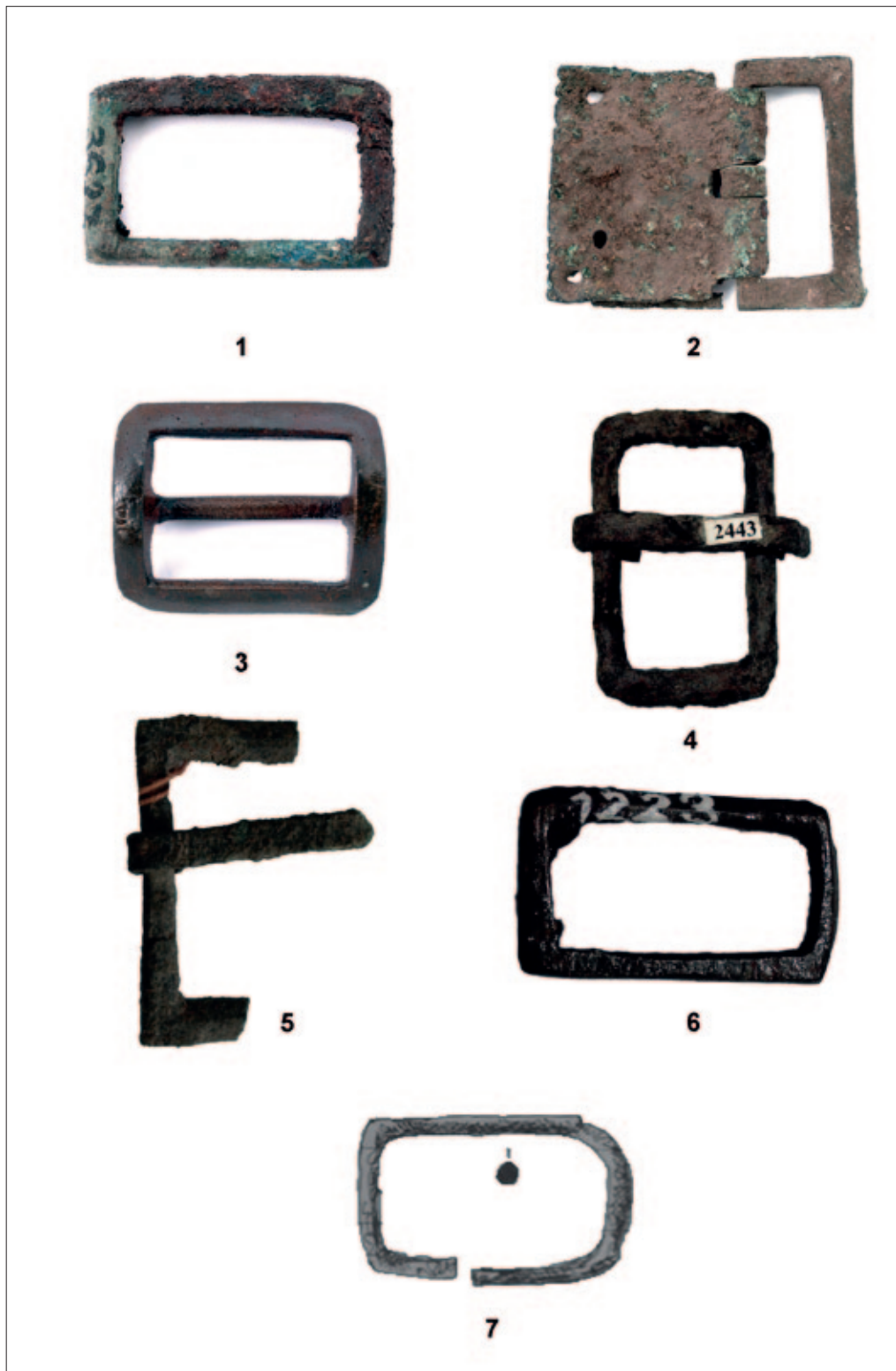
Sl. 7 1–2 Čapljina – Mogorjelo; 3 Stolac; 4 Sarajevo – Stup; 5 Čapljina – Mogorjelo; 6 Sarajevo – Ilidža; 7 Breza