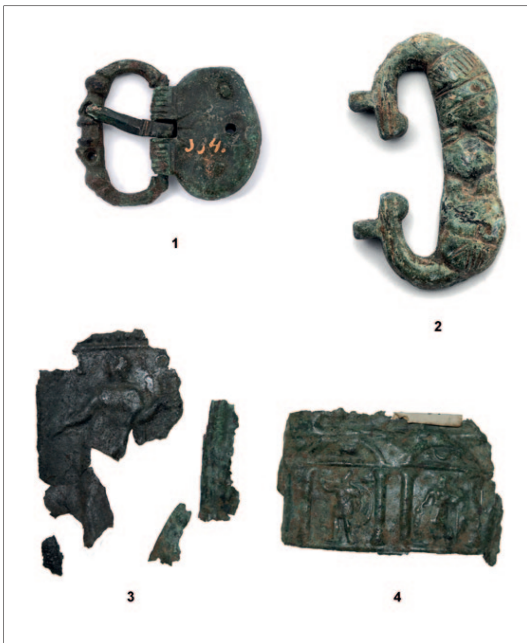
Sl. 8 1 Stolac; 2 Japra – Majdanište; 3–4 Čapljina – Mogorjelo Fig. 8 1 Stolac; 2 Japra – Majdanište; 3–4 Čapljina – Mogorjelo

Late Antique buckles with animal-head decoration on the frame typically have a pair of such heads on the frame (Košćević 1991: 68), face to face, usually at the point where the pin rests (Busuladžić 2018: 44), but in some cases at the chape end. The heads may be so stylised that it is possible only to guess at the animal they represent, but some heads are clearly of a recognisable animal: dolphins, water-birds, horse-head protome, lions, panthers, snakes, birds with outspread wings, and many other varieties of animal (Busuladžić 2018: 44). This feature is the principal structural and also decorative characteristic of this type of buckle (Redžić 2013: 163). In some cases the decorative design may also correspond to that of astragal buckles, where the