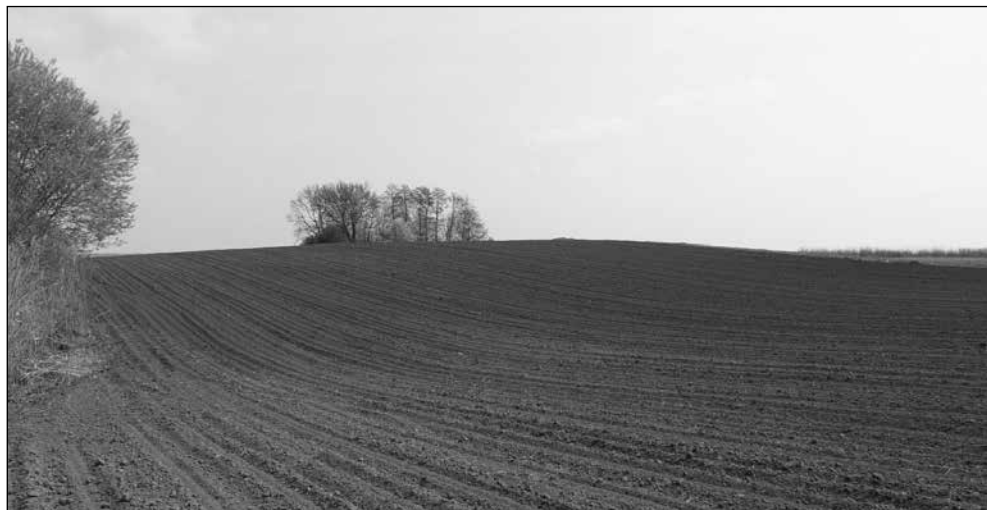
Slika 1. Pogled na lokalitet Kešinci - Požarike

nije. 21 Lokalitet je evidentiran i kao naselje kostolačke kulture koje je otkriveno u novijem razdoblju. 22 Lokalitet je kružnog tlocrta, promjera stotinjak metara te se ističe svojom visinom od okolnog terena (Slika 1.). 23 Terenskim obilaskom utvrđena je velika količina arheološke građe koja prevladava na samom hrptu ovog lokaliteta. Prevladava neolitička i eneolitička keramika, dok je manji broj srednjovjekovne i novovjekovne keramike.