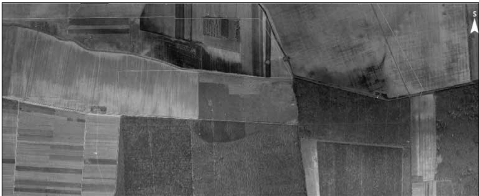
Slika 3. Lokalitet Mrzović – Gradina na snimkama iz 1968. godine (GEOPORTAL DGU, 2019.)

Snimka državne geodetske uprave iz 1968. godine jasno pokazuje razliku između stare i nove šume, odnosno dijela šume u nastajanju. Nadalje, pokazuje i prostor gradine naznačen svjetlijom bojom te nepravilna oblika (Slika 3.).