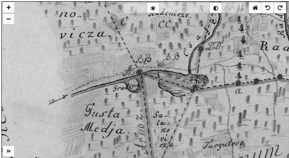
Slika 2. Prikaz lokaliteta Mrzović – Gradina na Mappa exhibens controversiam inter dominia Diakovar et Nustar (HUNGARICANA.HU, 2014.)

Snimka državne geodetske uprave iz 1968. godine jasno pokazuje razliku između stare i nove šume, odnosno dijela šume u nastajanju. Nadalje, pokazuje i prostor gradine naznačen svjetlijom bojom te nepravilna oblika (Slika 3.).