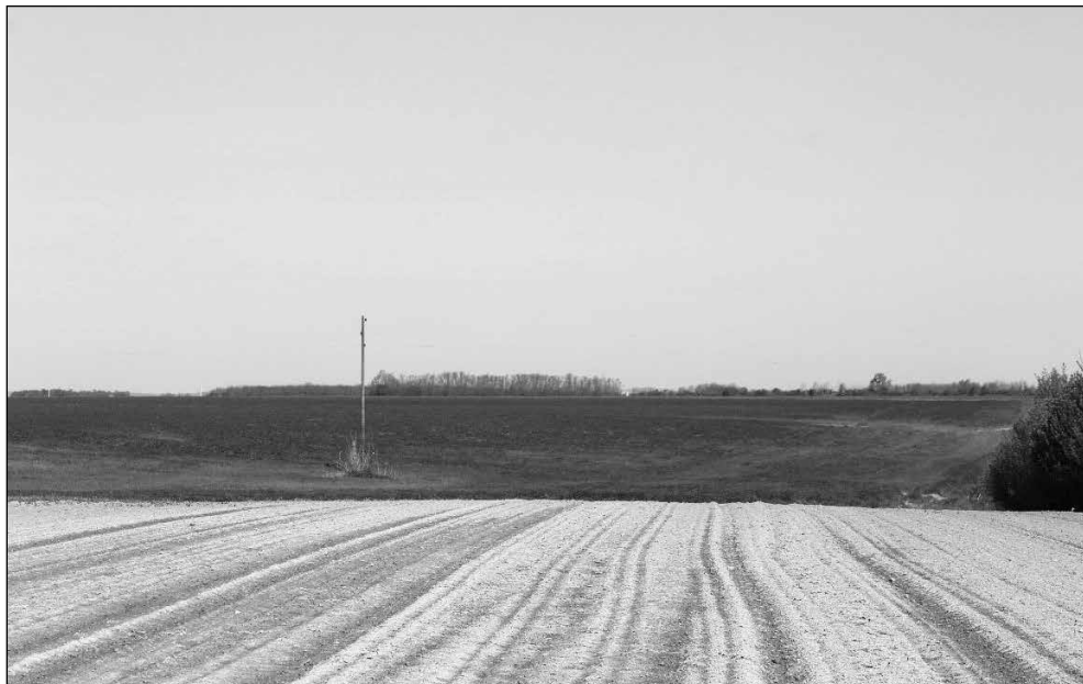
Slika 4. Toponim Ograde s pogledom prema sjeveru na lokalitet Vrbica – Barićev bostan

1,3 hektara te je širine 9 metara. Također, vidljiv je ulaz u središnji prostor s istočne strane. Relativna visina središnjeg dijela iznosi 0,5 metara. 89