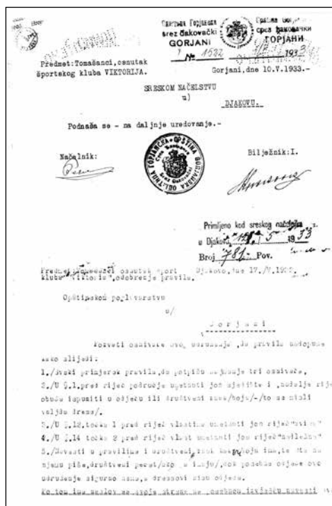
Dokumentacija koja je prethodila ishodu registracije kluba

Iz Pravila saznajemo da je naziv kluba Športski klub Viktorija, da djeluje i radi na području Tomašanaca, da mu je svrha „gojiti sve grane športa” te da je klupska boja bijelo – crna. 18