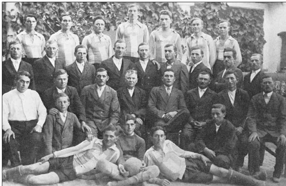
Športski klub Viktorija

1933. godine, igralište je bilo na livadi obitelji Listić. No, ona je bila premala, pa se tražilo novo, bolje rješenje. Pronašlo ga se na posjedu braće Lovrić. Napravljeno igralište nalazilo se na lijevoj strani ceste prema Ivanovcima.