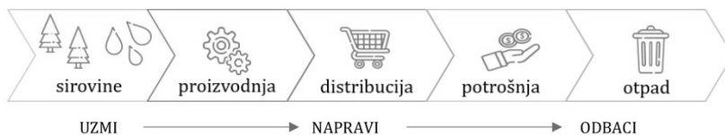
Slika 1. Prikaz koncepta linearne ekonomije

Prijelaz s linearne na kružnu ekonomiju neizbježan je jer se linearna proizvodnja veže s masovnom proizvodnjom i potrošnjom sirovina, bez brige o mogućim ograničenjima dostupnosti istih sirovina (Geissdoerfer i sur., 2017). Kao inovativan ekonomski i proizvodni model, kružna ekonomija prvenstveno podrazumijeva promjenu u načinu razmišljanja koji otpad smatra potencijalno korisnim resursom, a ne kao problem gdje će se i kako njime upravljati i odlagati ga, kao što je slučaj u linearnoj ekonomiji (Andrews, 2015). Koncept kružne ekonomije nastoji zamijeniti još uvijek dominantniju, linearnu ekonomiju (Slika 1) koja se temelji na principu napravi-iskoristi-odbaci . Prema Palafox-Alcantar i sur. (2020), kružna ekonomija skup je principa i alata kojima je cilj pridonijeti održivosti planeta smanjenjem eksploatacije i razgradnje materijala, promicanjem očuvanja resursa i energije ( smanjiti, ponovno upotrijebiti, oporaviti i reciklirati ) te potaknuti njegovu obnovu (Slika 2).