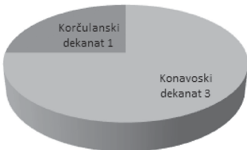
Slika 2: Crkvene župe s titularom sv. Nikole po dekanatima Dubrovačke biskupije