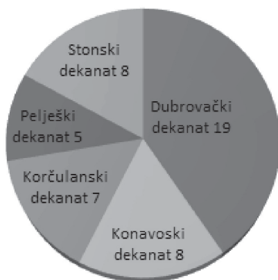
Slika 1: Župne crkve, kapele i samostani s titularom sv. Nikole po dekanatima Dubrovačke biskupije

Stonski dekanat: Lisac - Gospa od Rozarija: Sv. Nikola u Trnovici (kasnosrednjovjekovna crkva); Ošlje - Župa sv. Roka: Sv. Nikola na Gorici (srednjovjekovna); Ponikve - Župa sv. Ivana Krstitelja: Sv. Nikola u Boljenovićima (15. st.); Sv. Nikola u Dubi (1464.); Ston - Župa sv. Vlaha; franjevački samostan sv. Nikole (1347.) 42 ; Sv. Nikola u Česvinici (16. st., 1997.); Maranovići - Župa sv. Antuna Opata; Sv. Nikola u Okuklju (1626. - 1667.). 43