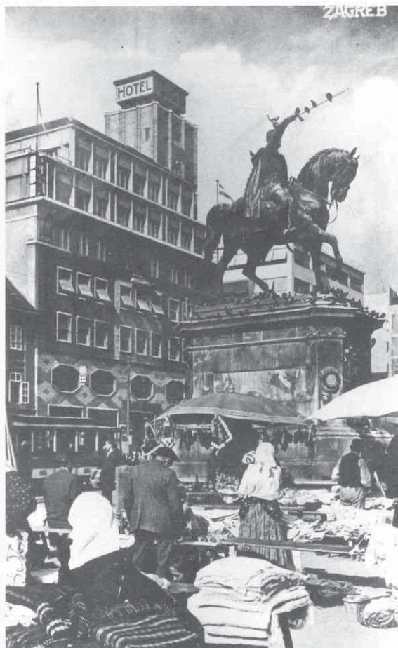
Griesbach i Knaus: Zagrebačka razglednica s kraja tridesetih godina

ma i fotografijama. Trodimenzionalni ga predmeti, povijesno značajni, ne zanimaju odviše. No, vremenski raspon njegova interesa je velik: od petnaestostoljetnog dokumenta na pergameni do razdoblja NDH 1941-1945. Među obiteljskim arhivima spomenuo je posjedovanje dokumenata o obitelji Lobkowitz, o