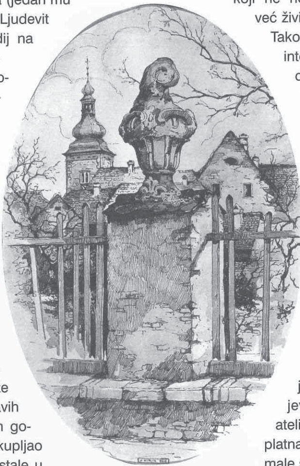
V. Kirin: Pogled na crkvu Sv. Marka, 1920.

zbirki takvih radova u Zagrebu. U njoj se nalazi oko stotinjak slika, ali su znatno brojniji crteži, pa i veći opusi, primjerice, V. Kirina, V. Radauša, K. Hegedušića, Z. Price, E. Murtića i inih. Zrcalno s tom zbirkom valja promatrati već spomenute impresionističke likovne kri-