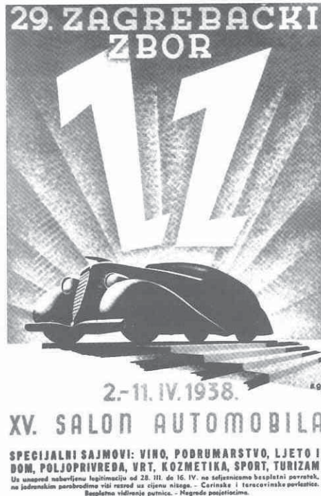
Sergije Glumac, 29. Zagrebački zbor, 1938.

vanje vizualnih komunikacija i funkcionalnih predmeta) tuzemnih stvaralaca ponajbolje su generirali i operacionalizirali potrebe toga novoga društva. Dakako, konstantne političke i gospodarstvene mijene, praćene ekonomskim nestabilnostima pa i ratovima, doprinijele su specifičnostima lokalnog konteksta koji nikada nije uživao dovoljno dugo mira da bi se u sklopu društva blagostanja i arhitektura i dizajn razvili u normalnu strategiju razvitka zajednice. Takva povijest diskontinuiteta hrvatske moderne kulture očita je iz mnogih primjera, na žalost - danas više nego slabo poznatih iz poluizgubljenih arhiva neuspjelih projekata i propalih zamisli. Ipak, subjektivno je mišljenje autora ovih redova, čak i tako fragmentirani, pa čak i tako lokalnog značenja i