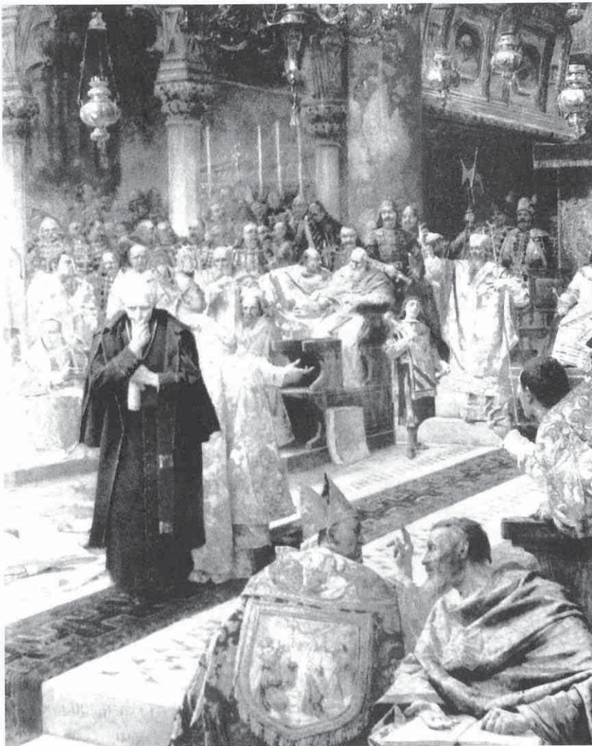
C. Medović, Splitski sabor 925.

mnogim europskim zemljama od Münchena do Pariza. Na Izložbi u Budimpešti 1896. njegova je umjetnost stekla veliki ugled. Ugarska komisija za kupovinu htjela je isprva za Muzej kupiti njegovu najpoznatiju sliku, no budući da ona nije bila na prodaju, kupljen je jedan drugi Medovićev izložbeni primjerak.