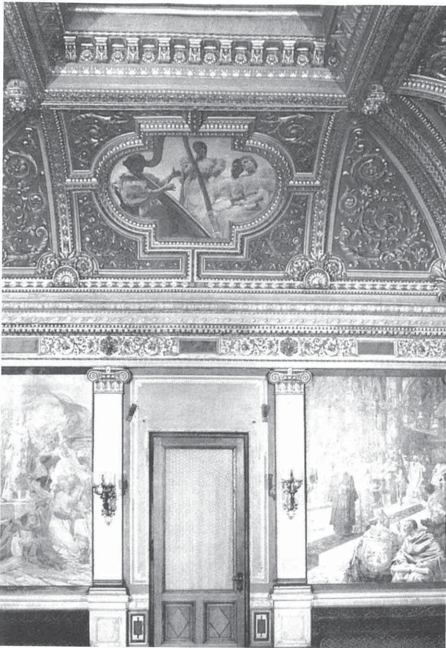
Zlatna dvorana, Opatička 10, Zagreb

ljeća, a u vlasništvu Muzeja likovnih umjetnosti, dio ikonografskog programa koji je dr. Iso Kršnjavi smislio za uređenje Palače u Opatičkoj 10. Godine 1882. je Odjel za bogoštovlje i nastavu zemaljske vlade preselio u nekadašnju palaču Vojkffy-Paravi, a dr. Iso Kršnjavi postao je njegov predstojnik. Odmah