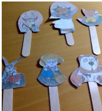
Slika 5: Primjer fotokopirane lutke na štapu – Mojca Pokrajculja

Najradije i najčešće koristim lutke na štapu , kuhači. Meni se jako sviđaju, brzo su napravljene i s njima možemo izraziti jako puno mašte. Možemo ih obući u odjeću od papira ili odjeću od tkanine, možemo biti jako kreativni u izradi kose – frizure. Učenici stvarno jako, jako uživaju. Naravno, pojave se i oni, koji imaju poteškoće s kreativnošću te su manje spretni rezanjem i lijepljenjem te im sve ide naopako, stoga su onda tužni jer im lutka nije lijepa. Tim učenicima pomažem tako, da na papir natisnem likove koje trebamo za predstavu. Učenici ih zatim samo izrežu i zalijepe na štاپ odnosno kuhaču. Ako žele mogu i jedno i drugo. Tako smo svi zadovoljni te u izrađivanju ne samo uživamo već i puno naučimo. U izradi lutaka opušteno razgovaramo i time već tada vježbamo tekst, koji će kasnije govoriti oživljenja lutka.