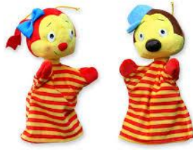
Slika1: Lutke Lili i Bine

https://www.google.com/search?q=lili+in+bine&source=lnms&tbn=isch&sa=X&ved=2ahUKEwj73ZD-vc7zAhUm_rslHY2TCbgQ_AUoAXoECAEQAw&biw=1920&bih=937&dpr=1#imgrc=Jyc4OKpXTrr68M