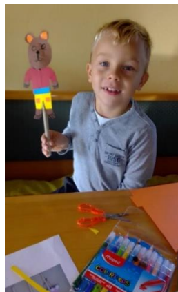
Slika 8: Nasmijano i zadovoljno dijete uz izrađenu lutku na kuhači – Pod medvjedićevim kišobranom