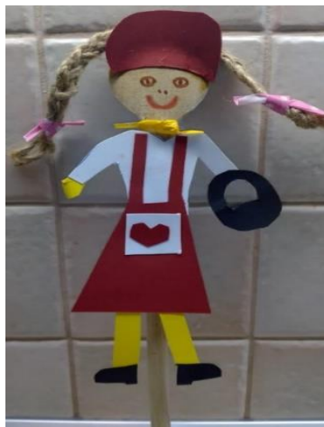
Slika 7: Primjer lutke od papira na kuhači - Crvenkapica