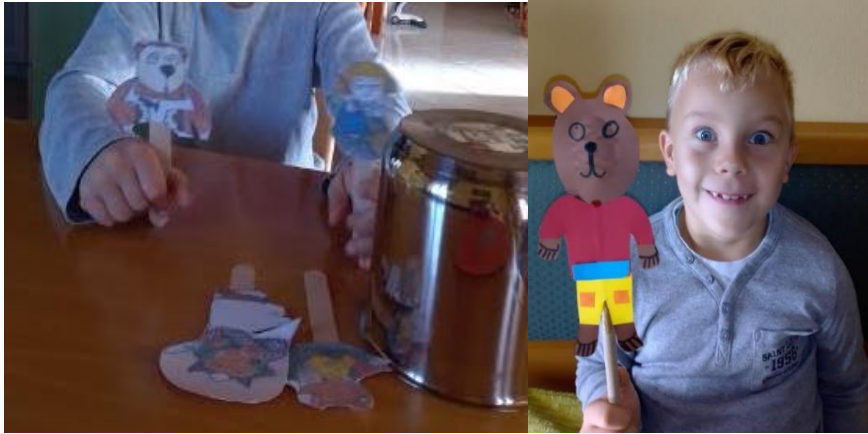
Sliki 9,10:Lutka je oživjela – nastup s lutkom

Nastavu volim obogatiti ručnim lutkama . Djeci se također jako sviđaju pa ih vole i sami izrađivati. Radimo ih iz ostataka tkanine i vune te ih nakon toga stavimo na ruku i odmah počinje akcija. Čim je lutka napravljena, uspostavljen je kontakt i dijete s njom već može razgovarati. Primijetila sam da se djeca s lutkom na ruci često sklone u neki kutak i prepuste svojoj mašti te uživaju u svijetu igre, gdje je sve dozvoljeno i ispravno. Mnogi lutku približe ušima, šapću joj, a na licu im sja zadovoljstvo i mir. Tada vidim da sam postigla sve ciljeve, čak i više od toga. Najviše mi znači, kada vidim da je dijete sretno i zadovoljno.