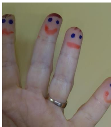
Slika 2: Na prste nacrtane lutke - lutke na prste

U nastavi povremeno upotrijebim i lutke na prste koje nacrtam na prste ruke. To vole napraviti i djeca, jer su lutke brzo napravljene i svaki dan mogu biti drugačije. Po potrebi oko prsta zavežu i traku tkanine i lutka je već obučena i odmah spremna na nastup.