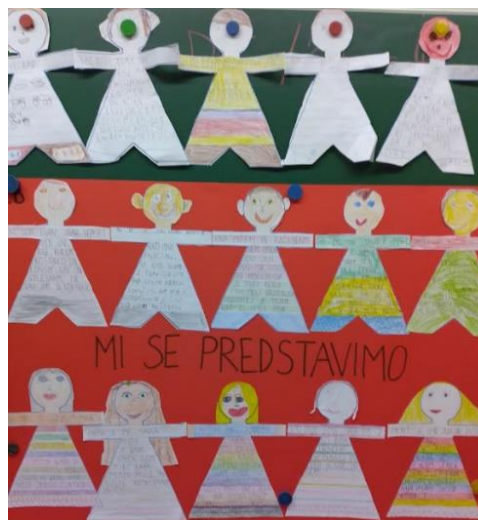
Slika 14: Ispisane lutke izrezane iz papira

Često odlučim i nacrtam lik, lutku na papir i učenici na nju napišu što žele da nam taj lik poruči. Prije nekoliko vremena napravili smo baš to, tada smo na taj način predstavljali sami sebe. Oblikovala sam šablonu djevojčice i dječaka. Svatko je uzeo šablonu, ocrtao je i na nju napisao nekoliko riječi koje su predstavljale njega/nju. Zatim su napisano pročitali kolegama u razredu. Moram reći, da su me pozitivno iznenadili, jer su lutke o njima ispričale puno više nego što su oni sami o sebi rekli bez lutaka.