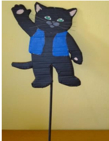
Slika 6: Lutka na štapu – Maček Muri