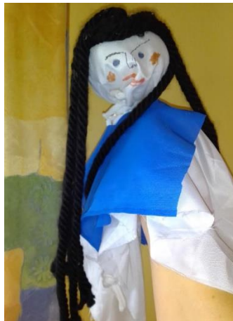
Slika 11: Ručna lutka iz ostataka tkanine i vune

Nastavu volim obogatiti ručnim lutkama . Djeci se također jako sviđaju pa ih vole i sami izrađivati. Radimo ih iz ostataka tkanine i vune te ih nakon toga stavimo na ruku i odmah počinje akcija. Čim je lutka napravljena, uspostavljen je kontakt i dijete s njom već može razgovarati. Primijetila sam da se djeca s lutkom na ruci često sklone u neki kutak i prepuste svojoj mašti te uživaju u svijetu igre, gdje je sve dozvoljeno i ispravno. Mnogi lutku približe ušima, šapću joj, a na licu im sja zadovoljstvo i mir. Tada vidim da sam postigla sve ciljeve, čak i više od toga. Najviše mi znači, kada vidim da je dijete sretno i zadovoljno.