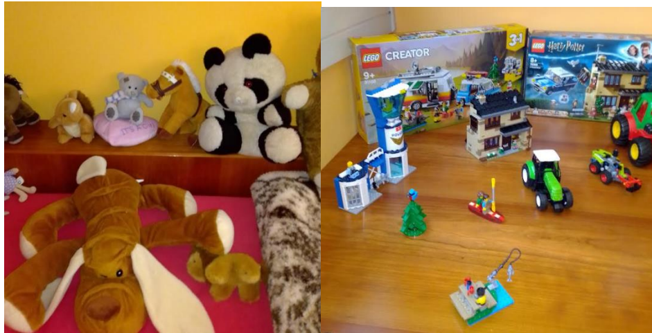
Slike 12, 13: Igračke kao pomagala za učenje

Često odlučim i nacrtam lik, lutku na papir i učenici na nju napišu što žele da nam taj lik poruči. Prije nekoliko vremena napravili smo baš to, tada smo na taj način predstavljali sami sebe. Oblikovala sam šablonu djevojčice i dječaka. Svatko je uzeo šablonu, ocrtao je i na nju napisao nekoliko riječi koje su predstavljale njega/nju. Zatim su napisano pročitali kolegama u razredu. Moram reći, da su me pozitivno iznenadili, jer su lutke o njima ispričale puno više nego što su oni sami o sebi rekli bez lutaka.