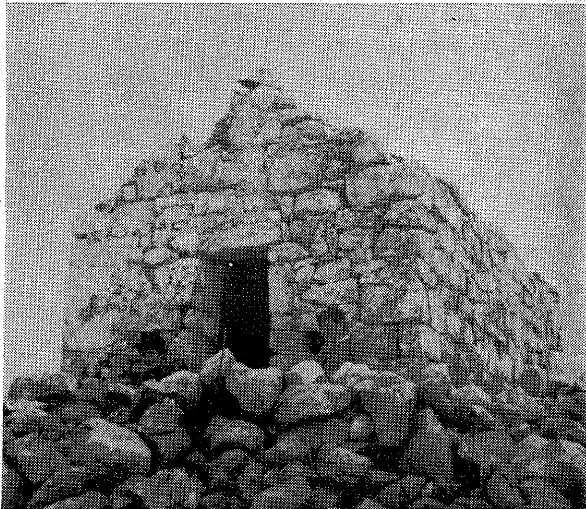
Crkvice sv. Paškala na Gračkim Stinama (712 m)

Crkvice je presvođena bačvastim svodom, koji na obje strane završava s ukusnim kamenitim vijencem. Nekadašnji oltarić je porušen.