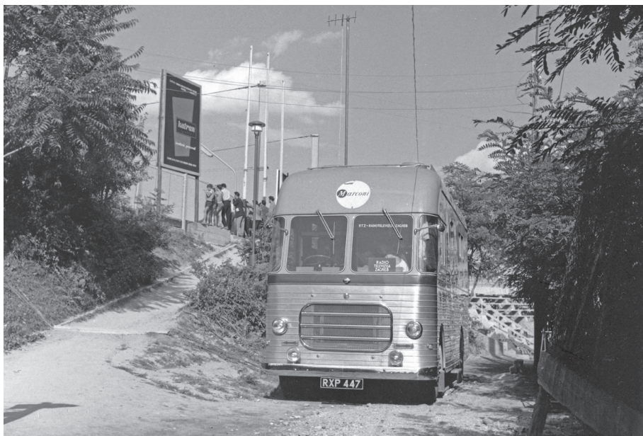
Slika 5. Prva reportažna kola Radiotelevizije Zagreb (Marconi), 1957.

Sredinom 1957. RTZ je kupio u Londonu svoja prva televizijska reportažna kola. To je bilo posebno važno za prijenose raznih manifestacija i sportskih događanja. S novim reportažnim kolima prvi prijenos realiziran je sredinom srpnja 1957. sa završne priredbe II. gimnaestrade sa stadiona u Maksimiru, a sredinom kolovoza i vaterpolski turnir „Trofeo Italia” s plivališta na Šalati. Prvi prijenos iz dvorane s reportažnim kolima RTZ je ostvario 1. kolovoza 1957. prenoseći svečanu akademiju u čast 20. godišnjice Osnivačkoga kongresa Komunističke partije Hrvatske iz velike dvorane Radničkoga doma. Sljedeći veliki projekt bio je prijenos otvaranja Zagrebačkoga jesenskog velesajma, prvi put s reportažnim kolima. Preko ljetnih mjeseci 1957. RTZ je davao samo skraćeni nedjeljni program (televizijski dnevnik i sportski pregled). S redovnim emitiranjem nedjeljom, uobičajenoga trajanja od jednog i pol do dva sata programa, nastavljeno je početkom studenoga. Tijekom ljeta su osmišljene neke nove emisije, formirane nove redakcije (kulturno-umjetnička) i pokušalo se da program dobije određenu fizionomiju te svojom zanimljivošću privu-