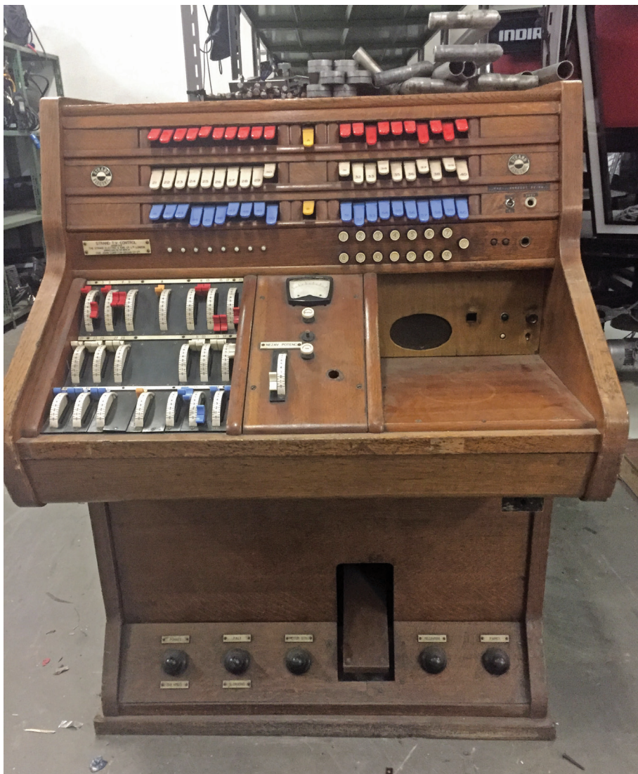
Slika 7. Rasvjetni pult marke Strand (upravljačka konzola na kućištu orgulja), kupljen 1958. za studio u Šubićevoj ulici (danas u skladištu rasvjete HRT-a, privatna zbirka)

Prvi program Radiotelevizije Beograd emitiran je 23. kolovoza 1958. popodne i navečer povodom otvaranja 2. sajma tehnike i tehničkih dostignuća održanog u Beogradu, što je ujedno početak emitiranja eksperimentalnoga programa Radiotelevizije Beograd. Program će se davati cijelo vrijeme traja-