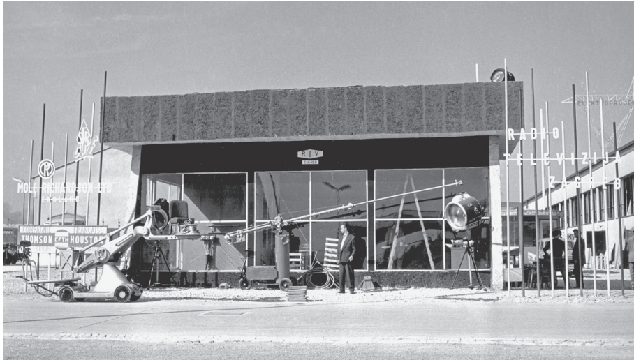
Slika 4. Prvi studio na Zagrebačkom velesajmu, 1956. (autor Đuro Slako, Fototeka HRT-a)

Takav ubrzani plan izgradnje televizijske mreže u Hrvatskoj nikad nije ostvaren u punom obimu. Izgradnja se u stvarnosti protegnula na gotovo dva desetljeća. Autori plana bili su svjesni da pri svemu što su zamislili i predložili treba voditi računa o tome da je vrlo neekonomično proizvoditi televizijski program koji zahtijeva prilično velike materijalne troškove za usko teritorijalno područje i mali broj gledatelja u tadašnjoj Hrvatskoj.