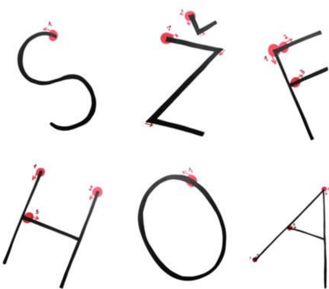
Slika 3: Redosljed linija u različitim slovima abecede.