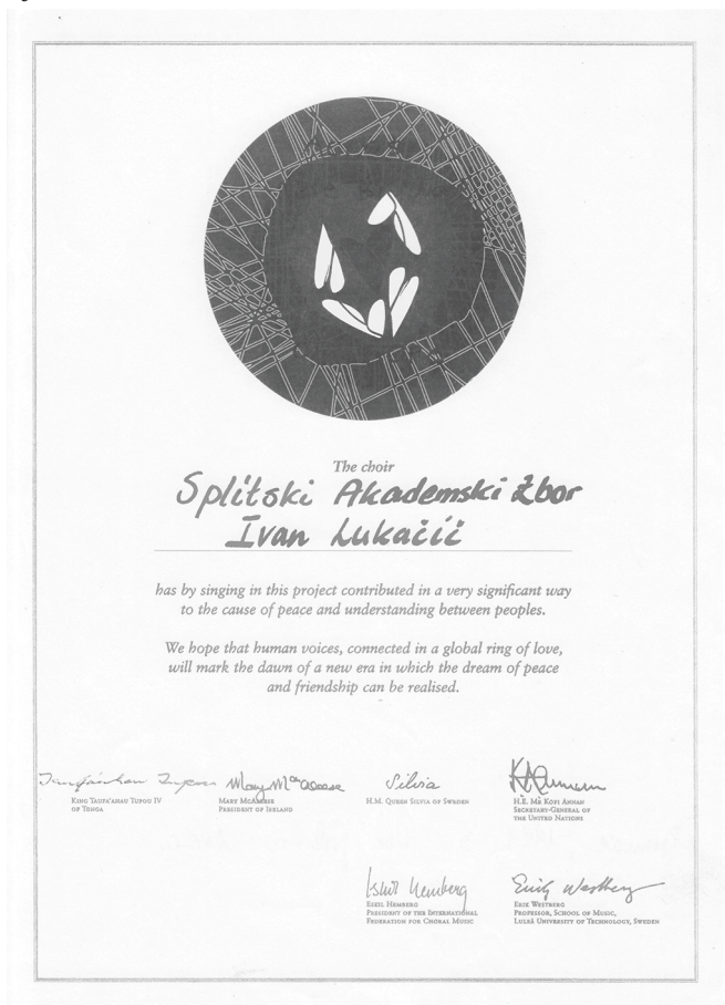
Slika 7. Priznanje zboru »Ivan Lukačić«