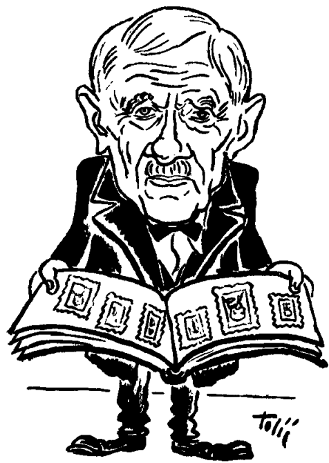
7. Franjo Bartovski (filatelist)