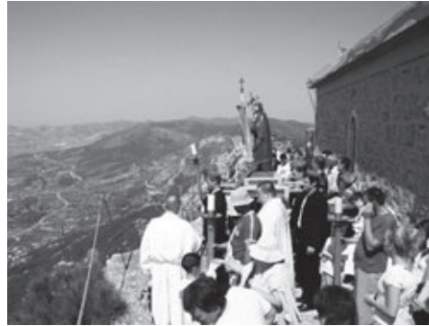
Vjernici okupljeni za svetkovine sv. Ivana Krstitelja na Birnju 24. lipnja 1951. godine nakon što je crkva ponovno obnovljena poslije stradanja u Drugom svjetskom ratu te desno 24. lipnja 2012. godine