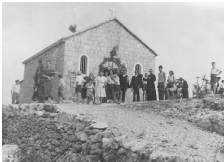
Pročelje novo proširenog dijela crkve sv. Ivana Krstitelja na Birnju na kojem se još uvijek vidjelo mjesto iznad ulaznih vrata, gdje je prvotno stajala spomen-ploča iz 1888. godine (photo: 1951. g., vl. S. Viculin)