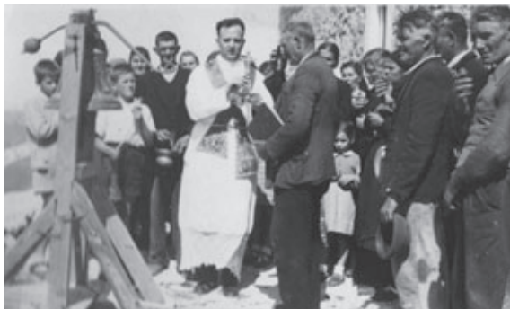
Zvono na drvenoj konstrukciji 1953. g., koje se koristilo i u ranijim razdobljima jer crkva sv. Ivana na Birnju nema preslicu za zvono