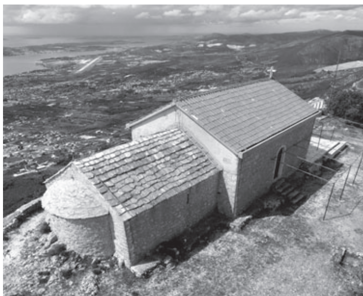
Slojevi crkve sv. Ivana Krstitelja na Birnju s romaničkom apsidom, kasnogotičkim dijelom u sredini i novovjekovnim proširenjem