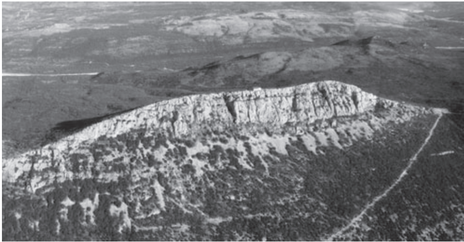
Crkva sv. Ivana Krstitelja na brdu Kozjak (631 m) s prepoznatljivom kamenom liticom nazvanom »Kruna«

Pored toga, potomci utemeljitelja redovito su se okupljali na svetkovinu Glavosjeka sv. Ivana Krstitelja, kada ih je upravitelj beneficija ujedno častio godišnjim ručkom, koji se nazivao didiščina . No, broj potomaka s biračkim pravom progresivno je rastao s obzirom da je pravo biranja upravitelja (kojeg izvori još nazivaju juspatron , pleban , nadarbenik ili rektor ) jednako preneseno na muške i ženske potomke. 5 Zapravo se po tome ključu upravitelj birao sljedećih 530 godina, tj. od prvog poznatog spomena beneficija iz notarskog spisa 1276. godine do njegova ukidanja za francuske uprave 1806. godine. 6