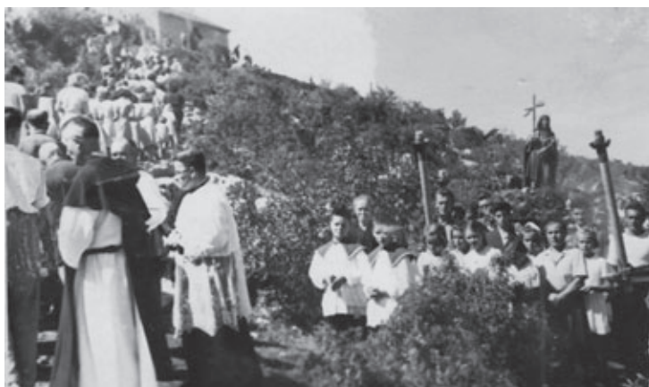
Procesija sv. Ivana na Birnju šezdesetih godina u zadnjem usponu prema crkvi

Tijekom Drugog svjetskog rata, odnosno 1942. godine crkva na Birnju oštećena je talijanskim bombardiranjem, ali, već u poratnim godinama FNRJ-a crkva je 1951. godine obnovljena, s time da je cjelokupan materijal tijekom jedne noći prenesen na brdo. 47 Unatoč