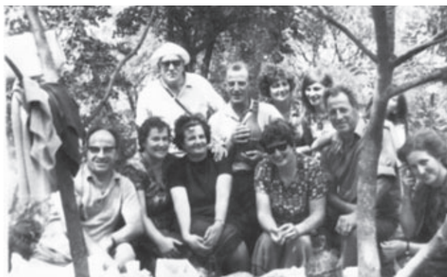
Za obiteljskim stolom tridesetih godina na Birnju (gore: photo vl. S. Viculin) i sedamdesetih godina 20. stoljeća (dolje: photo: vl. L. Vuletin)

Za svetkovina sv. Ivana narod je nakon juturnjih svetih misa ostajao na brdu Kozjak sve do večernjih sati. Štoviše, tradicija blagovanja seže još od srednjovjekovnog beneficija, kada je njegov upravitelj častio objedom ostale juspatrone . Tijekom druge polovice 20.