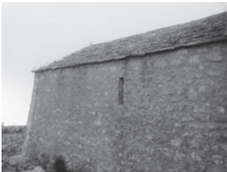
Sačuvana puškarnica na kasnogotičkom dijelu crkve sv. Ivana Krstitelja na Birnju

U takvim okolnostima 1579. godine crkvu sv. Ivana na Birnju vizitirao je Augustin Valier. Ona je imala oštećen krov i vrata, što je bio odraz tadašnjih ratnih prilika, jer se crkva našla na samoj granici. Iz te vizitacije također je razvidno da beneficij i dalje egzistira, unatoč preseljenju stanovništva iz srednjovjekovnog Ostroga u novoutvrđeno naselje na obali. Odnosno, na svetkovinu Glavosjeka ustaljeno se služila sveta misa na Kozjaku i poslije na brdu priređivala okrepa hranom po starom običaju za potomke nekadašnjih osnivača beneficija, neovisno o tome što se crkva sv. Ivana na Birnju našla u neposrednoj blizini granice i sve učestalijih sukoba, pljačkanja, paleži i otmica od strane Osmanlija. Uostalom, na crkvi su još uvijek sačuvana dva otvora koja su služila za puškarnice, što upućuje na činjenicu da se ona mogla koristiti i za obranu u slučaju napada Osmanlija. U tome razdoblju u crkvi sv. Ivana Krstitelja na Birnju vizitator je zatekao glavni oltar sa svečevom slikom, a za služenje svete mise liturgijske predmete donosilo se iz župne crkve. 20