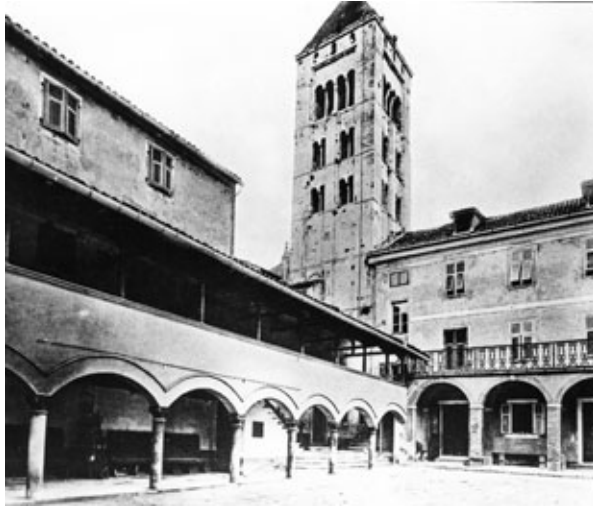
Slika 1a. Samostan prije savezničkog razaranja 1944.

Zadar da se dopusti obnova samostana sv. Marije, na što su dobili odbijenicu pod objašnjenjem da se tu prema urbanističkom planu imaju graditi gradski muzeji.