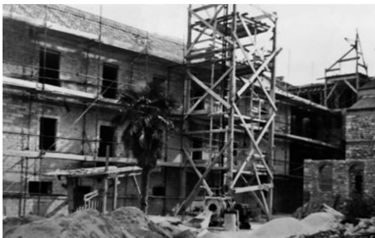
Slika 2 b. Radovi na obnovi samostana

Slika 2. Unutarnji dio porušenog samostana sv. Marije i radovi na obnovi