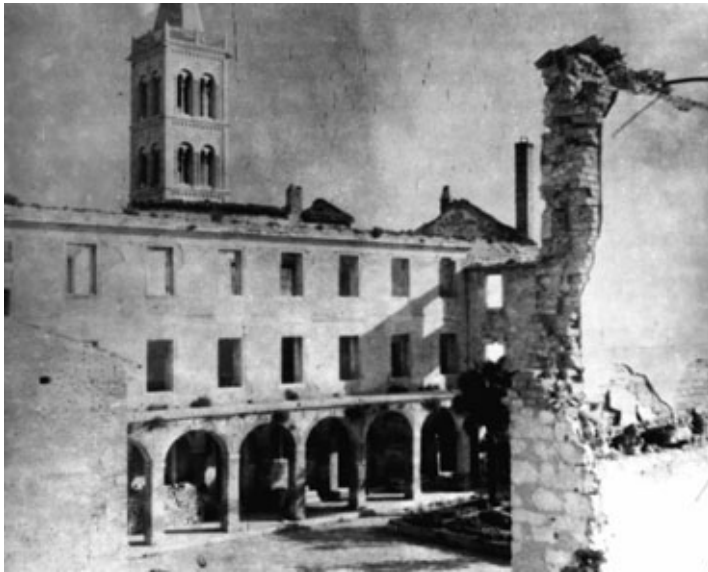
Slika 1 b. Samostan nakon savezničkog razaranja 1944.

Slika 1. Samostan prije i nakon savezničkog razaranja 1944.