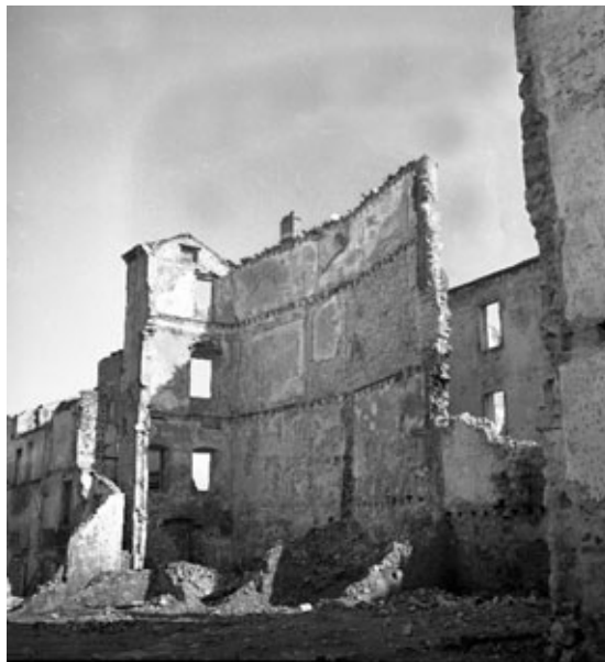
Slika 2 a. Unutarnji dio porušenog samostana