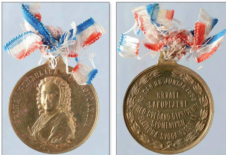
Slika 5. Medalja ukrašena vrpcom u bojama hrvatske trobojnice. Na aversu se nalazi Gundulićevo poprsje ispod kojeg su smještene dvije grančice lovora. Na reversu se nalazi natpis opasan lovorovim grančicama: “na dan 26. junia 1893. Hrvati sakupljeni pred svečano otkrivenim spomenikom slavnog svog pjesnika”. Prema: B. Lasić i D. Lokas, Dubrovačke medalje i plakete : 47.