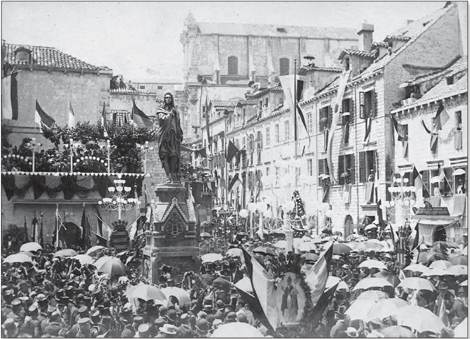
Slika 2. Otkrivanje spomenika. Na fotografiji se vide zastave koje su građani vješali niz prozore kuća. Prevladavaju hrvatska i srpska trobojnica. Fotografijom su obuhvaćena i dva vijenca. Prednji vijenac, koji bi po svemu sudeći mogao biti vijenac dubrovačke općine, u središnjem štitu ima lik sv. Vlaha, a s lijeve i desne strane nalaze se hrvatska i srpska trobojnica ( http://www.dumus.hr/hr/kulturno-povijesni-muzej/novosti/otkrivanje-spomenika-ivanu-gundulicu-1893.-godine,338.html ; pristup: 17. 12. 2020).

Na Poljani je bila postavljena plinska rasvjeta, a prostor je bio okićen girlandama, cvijećem, ukrasnim balonima (slika 2) te četirima zastavama: carskom, dubrovačkom, hrvatskom i srpskom. 63 Prostor oko spomenika bio je ograđen bijelom ogradom koja je po završetku središnje ceremonije uklonjena (slika 3). Balkoni i prozori kuća uz Poljanu bili su ukrašeni cvijećem i girlandama, 64 a s prozora su se vijorile zastave od kojih su prevladavale one u bojama hrvatske ili srpske trobojnice, pokazujući time različite nacionalno-političke lojalnosti