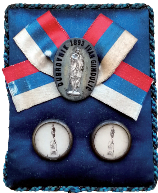
Slika 6. Značka s dvama bedževima i vrpcom u bojama srpske trobojnice. Na znački stoji natpis: “Dubrovnik 1893 Ivan Gundulić”.