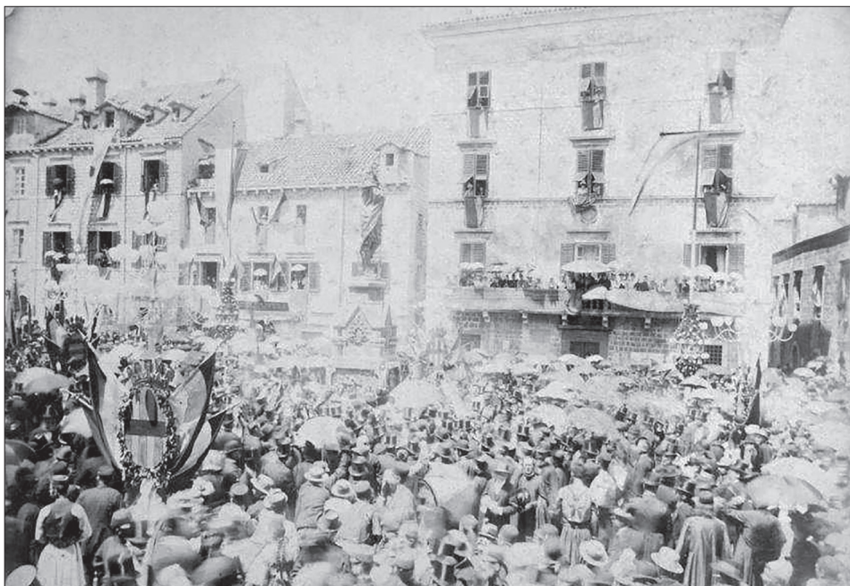
Slika 4. Fotografija sudionika svečanosti. U pozadini se vidi balkon Mavnerijeve kuće na kojemu su se okupili gosti koji su promatrali svečanost. Izvor: Dubrovački muzeji (DUM KPM D-1220-1).

Pored isticanja zastava na prozore kuća, sudionici svečanosti svoj su nacionalni identitet iskazivali nošenjem ukrasa i zastava za vrijeme trajanja središnjeg ceremonijalnog dijela proslave. Mnogi su nosili ukrasne vrpce u bojama hrvatske ili srpske trobojnice te kokarde i barjake. Stanovnici Rijeke dubrovačke su, primjerice, u jutarnjim satima ušli u grad noseći na čelu hrvatsku trobojnicu na čijoj je svilenoj vrpici zlatnim slovima pisalo "Općina Riječka". 68 Za njima su potom ušli Zatonjani, Orašani, Trstenjani, Kliševljani, Lopuđani, Šipanjani i Stonjani, koji su vlastite nošnje ukasili hrvatskim trobojnim motivima. 69 Među posljednjima su pristigli Konavljani, noseći trobojne vrpce i kokarde, a u grad su ušli predvođeni zastavom cavtatske općine s hrvatskom trobojnicom, pucajući iz samokresa uz povike "Živjela Hrvatska!" 70 Sudjelovanje velikog