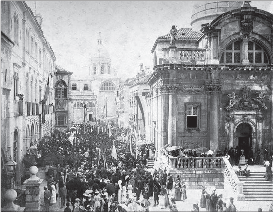
Slika 1. Okupljanje gostiju pred zgradom Općine. Zgrada je ukrašena zastorima, a s prozora se vijori carska crno-žuta zastava. Preko puta se vide zataknute zastave, od kojih je jedna trobojnica.

orijentaciju. Prije početka svečanosti Grad je stoga bio temeljito uređen i okićen. Ulice su bile očišćene, a zidovi oblijepljeni plakatima, pjesmama i pozdravima dubrovačke mladeži pisanim na ćirilici i latinici. 60 Prostor gruške luke u koju su uplovljavali parobrodi s gostima bio je okićen barjacima, stjegovima i zelenilom. 61 Općina je bila okićena ukrasnim zastorima, a sa zgrade su se vijorile dubrovačka i carska crno-žuta zastava. Na Orlandov stup organizatori su dali postaviti bijelu zastavu s likom sv. Vlaha. 62