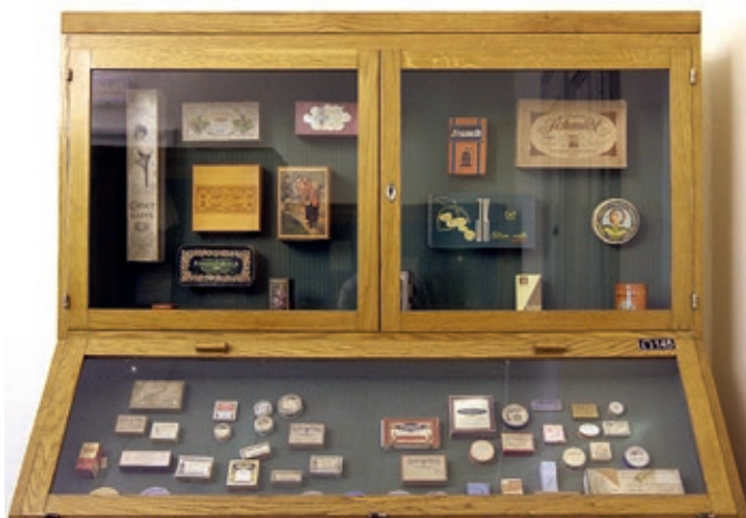
Sl. 2. Detalj postava Entomološkog odjela Gradskog muzeja Varaždin.