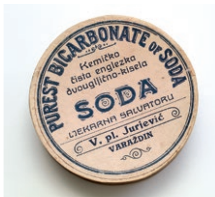
Sl. 2a Snimak izdvojenog primjera ambalaže iz Entomološkog odjela Gradskog muzeja Varaždin.