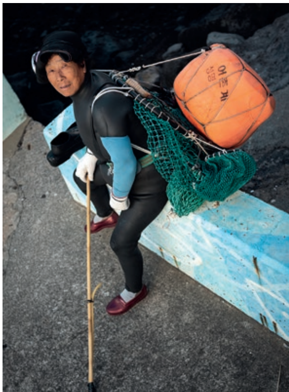
Sl. 1. Haenyeo u opremi, snimljena neposredno pred odlazak na zaron. Jeju City, 2017. g.