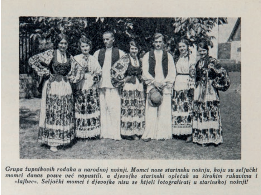
Sl. 5. Terensko istraživanje Martinske Vesi, 1931.g. dokumentacija Etnografskoga muzeja.