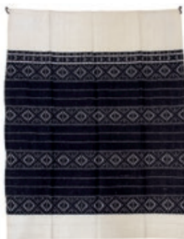
Sl. 8. Pregača, Kupinec, početak 20. st., EMZ 29136.

Fig. 7 Towel, Brezovica, beginning of the 20 th Century, EMZ 1647.