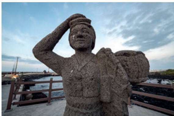
Sl. 2. Skulptura haenyeo . Jeju City, 2019. g.