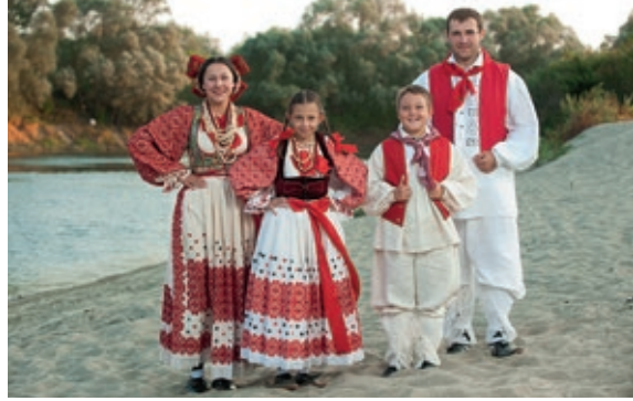
Fig. 1 Cultural artistic association "Posavec", Dubrovčak Lijevi, 2012.

Sl. 1. Kulturno umjetničko društvo "Posavec", Dubrovčak Lijevi, 2012.g.