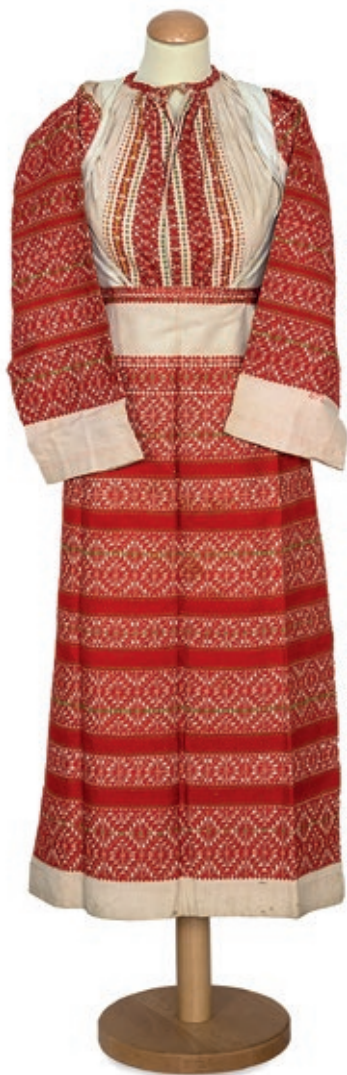
Sl. 6. Ženska nošnja, Brezovica, početak 19. st., EMZ 5148a-b.

Fig. 6 Women's folk costume, Brezovica, beginning of the 19 th Century, EMZ 5148a-b.