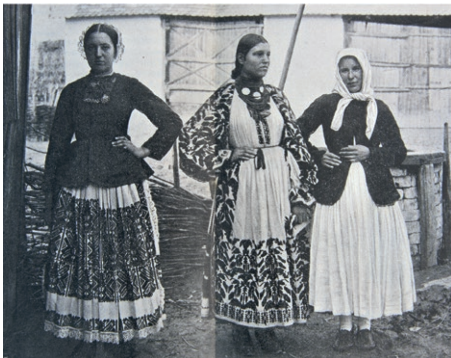
Fig. 4 The picture shows a woman in an apron decorated with silk, a girl prepares for marriage in "red cotton thread" and a middle-aged woman in mourning clothes. Trebarjevo, 1898. "Anthology of Folk Life and Customs of the Southern Slavs", vol. 3.

Sl. 4. Na slici su žena u pregači ukrašenoj svilom, djevojka za udaju u pisanini i žena srednje dobi u odjeći za žalost. Trebarjevo, 1898. "Zbornik za narodni život i običaje južnih Slavena", sv. 3.