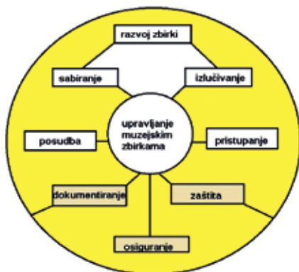
Sl. 1. Grafički prikaz procesa upravljanja muzejskim zbirkama.