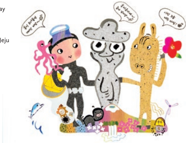
Fig. 3 Postcard "Come Play Jeju 01". Copyright © deart 2018.

Sl. 3. Razglednica "Come Play Jeju 01". Copyright © deart 2018. g.