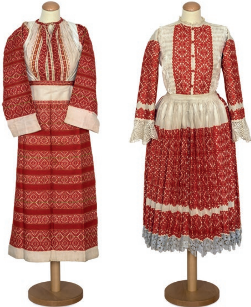
Sl. 9. Ženska nošnja, Brezovica, početak 19. st. EMZ 5148a-b; ženska nošnja Hrvatica , Martinska Ves, 2. pol. 20. st. EMZ 48144a-c.