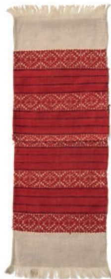
Sl. 7. Ručnik, Brezovica, početak 20. st., EMZ 1647.

Fig. 6 Women's folk costume, Brezovica, beginning of the 19 th Century, EMZ 5148a-b.