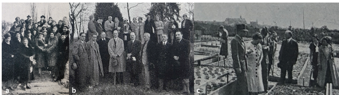
Slika 3. Polaznice prvog amaterskog vrtlarskog tečaja za gospođe 1933. u Zagrebu (a), polaznici i profesori amaterskog vrtlarskog tečaja 1934. u Zagrebu (b), članovi Hortikulturnog društva u Zagrebu na stručnoj ekskurziji u Beču 1935. (c).

praktičnom i teorijskom obukom, koji je organizirao Vale Vouk u Botaničkom vrtu u Zagrebu (Anonimus 6, 1936) te vrtlarski večernji tečaj (najniži stupanj naobrazbe vrtlara) u Botaničkom vrtu u Zagrebu, za vrtlare naučnike koji su u Vrtu bili zaposleni (Vouk 1934a). U Zagrebu se 1931. održao i tromjesečni vrtlarsko-voćarski tečaj u organizaciji Vale Vouka i gradskog inspektora za vrtlarstvo Nikole Modrića (Nestl 1931).