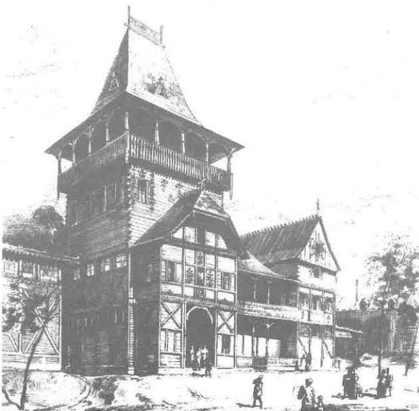
Hrvatski paviljon u Budimpešti 1886. godine (prešimka)

No, koje je rezultate, osim besprijeorne informacije o odgojnom zavodu u Lepoglavi, polučio opisan izloženi događaj? Kršnjavi ga je ovako ocijenio: “Naša prva izložba kućnoga obrta, priređena u novim prostorijama Akademije gdje je danas Galerija slika, uspjela je vrlo