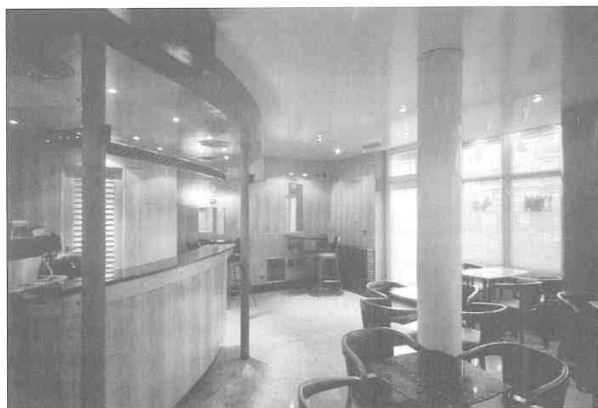
Cafe bar "Prince", Sesvete, 1994.