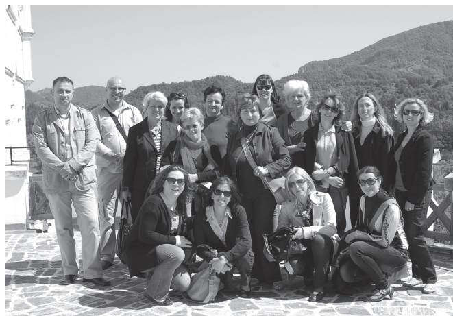
SLIKA/FIGURE 1. Sudionici 36. stručnog skupa Pulmološkog društva HUMS-a, Trakošćan 2012 / Participants of the 36 th professional meeting of the Pulmonology Society of CMA, Trakošćan 2012

In 2012, a conference with the working title Innovations in Pulmonology was held in Trakošćan [24]. The topic of the thirty-seventh conference held in Samobor in 2013 was Comorbidities in pulmonary patients [25]. Next year the 38th conference was held in Zagreb, presenting papers on the topic of Nursing diagnoses in pulmonology . The topic followed the increasingly current efforts that consider nursing diagnoses and their application as key to a successful, evidence-based and professionally guided health service, whose goal it is to better meet the needs of patients [26]. In 2015, the 39th conference was held on the topic of Oxygen therapy at home . On the conference the handbook for patients and health workers Oxygen application at home was presented [27]. The 40th jubilee professional meeting was held in 2017 in Klenovnik on the topic of Palliative Care and Rehabilitation in Pulmonology . Emphasis was put on the specifics of patient care in the chronic or terminal phase of lung disease [28].