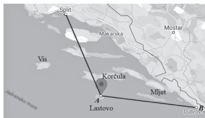
Slika 1. Položaj otoka Lastova

Smješten je južno od otoka Korčule, jugozapadno od poluotoka Pelješca i otoka Mljeta, a jugoistočno od otoka Visa. Dug je 9.8 km, a širok do 5.8 km.