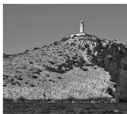
Slika 5. Otok i svjetionik Struga