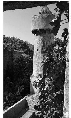
Slika 3. Lastovski „fumar”, dimnjak

Zadatak 9. Najviši vrh otoka Lastova je Hum . Njegova visina u metrima jednaka je iznosu abc . Broj abc veći je od 400, a manji od 500. Razlika znamenki jedinica i stotica je tri. Razlika znamenki stotica i desetica je tri. Otkrijte visinu Huma.