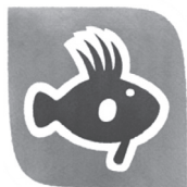
Slika 2. Logo parka prirode „Lastovsko otočje”

Obala je duga 49 km, a površina iznosi približno 41 km 2 . Danas na otoku Lastovu živi 791 stanovnik, a najveća naselja su Lastovo s 451 i Ubli s 218 stanovnika. Značajna naselja su još Pasadur, Zaklopatica i Skrivena Luka.