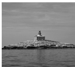
Slika 6. Otok i svjetionik Glavat