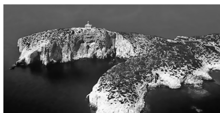
Slika 7. Otok i svjetionik Sušac https://proleksis.lzmk.hr/58313/

Zadatak 12: Kreirajte brojevni pravac na kojemu možeš prikazati godine izgradnje svjetionika Struge 1839., Sušca 1878., Glavata 1884.