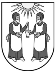
Slika 4. Grb Općine Lastovo, sv. Kuzma i Damjan, autor Željko Heimer

Zadatak 8. Možemo li reći da je motiv grba Općine Lastovo osnosimetričan? Obrazložite zašto.