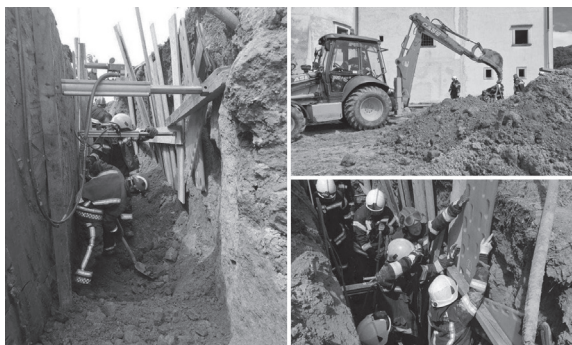
Slika 2. Izvlačenje tijela