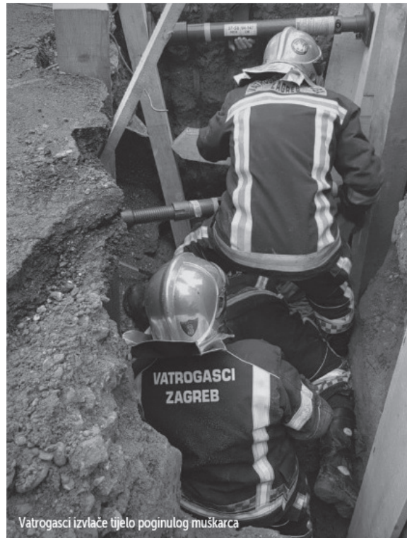
Slika 1. Izvlačenje tijela

Dva radnika poginula su zbog odrona zemlje te zatrpanja, prilikom obavljanja poslova spajanja plastičnih cijevi u kanalu dužine 8,5 m, širine 1,3 m i dubine 4,1 m, u kojem nije bila postavljena kanalna oplata kao osiguranje od urušavanja.