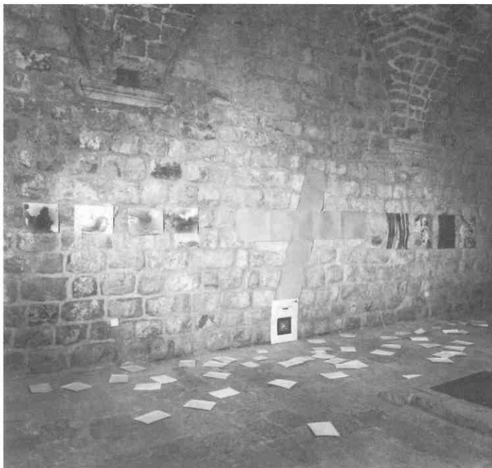
Željko Jerman, "Wohin geht die Welt, wohin geht die Photographie?", instalacija, 1970.-93./ Željko Jerman, "Wohin geht die Welt, wohin geht die Photographie?", installation, 1970-93

Značenje je ove izložbe i u tome što otvara proces osvještavanja i definiranja karaktera hrvatske suvremene umjetnosti. Što je to što je obilježava i razlikuje od drugih, bez obzira na internacionalni likovni jezik kojim se služi? To je potraga za vlastitim duhovnim temeljima. A oni se mogu otkriti, ne pasivnim prepoznavanjem svjetskih trendova na domaćoj sceni već samo aktivnim kritičkim odnosom prema pripadajućem nam stvaralaštvu. Prilično nezahvalan zadatak s obzirom na aktualno propovijedanje kulturnog nomadizma i eklekticizma. Ali utvrđivanje vlastita identiteta preduvjet je ravnopravne koegzistencije.