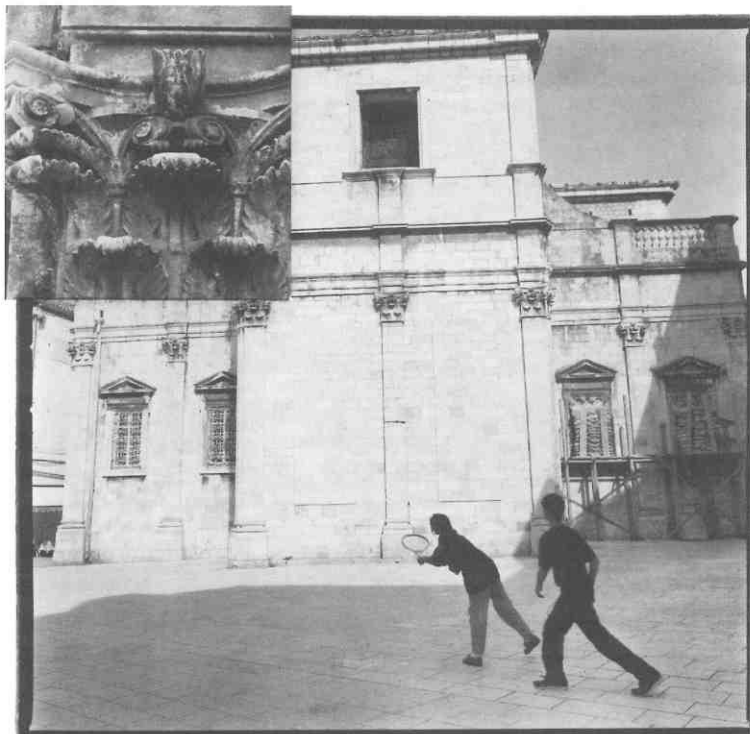
Slaven Toli, "Pax. Vobis. Memento mori Qui. Ludetis Pilla.", ready-made, 1993./Slaven Toli, "Pax. Vobis. Memento mori Qui. Ludetis Pilla.", ready-made, 1993

prostor. Rad od 10.5 m gotovo je skriven, uočuje se tek nakon nekog vremena ili tek prilikom izlaska iz Galerije. Rezultat je izložba rijetke vizualne čistoće, prostornosti i odmjerenosti. Raznorodni radovi s dovoljno vlastita zraka međusobno se ne nadmeću, nego decentno koordiniraju.