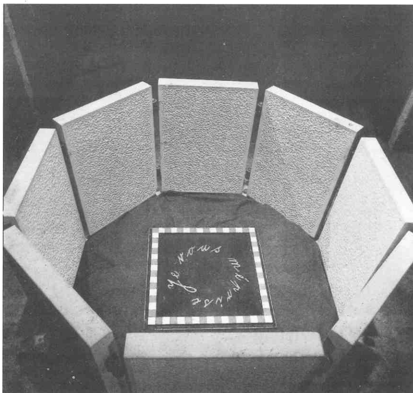
Antun Maračić, "Je vous méprise", instalacija, 1991./Antun Maračić, "Je vous méprise", installation, 1991

Odmak od klasičnog slikarskog postupka, zapravo njegovo ironiziranje, imaju i slike-objekti Gorana Trbuljaka. Platna je zatvorio drvenim okvirima, a s prednje strane staklom. Boju je utiskivao (i to u vremenskom razmaku od 1984. do 1992.) kroz male rupice u okviru ili sa stražnje