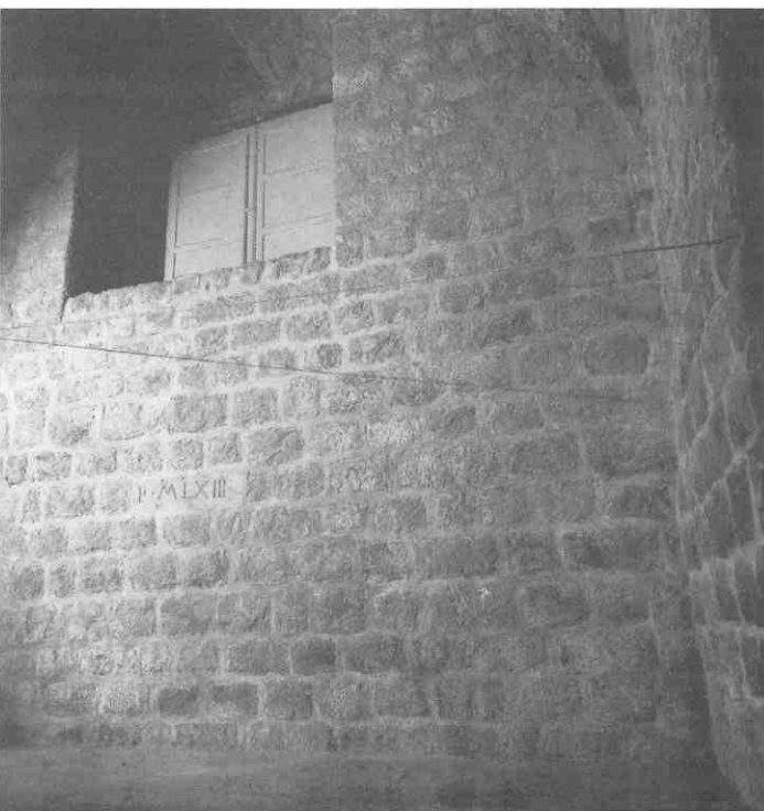
Goran Petercol, "Sjene / 123", instalacija, 1993./ Goran Petercol, "Shadows / 123", installation, 1993

Evelina Turković: "Dubrovnik Exhibition "Place And Fate"