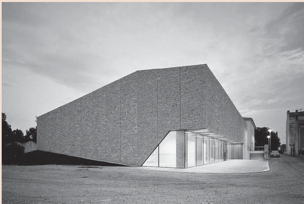
↑ Bale, Sportska dvorana, 2007.

Bale su zanimljiva lokalna priča. Lokalno stanovništvo uglavnom radi u Uljaniku ili u TDR-u, kod kuće dozidavaju kat da bi preko ljeta primili turiste, a županijski planovi namijenili su im dvije velike turističke zone na najboljim obalnim lokacijama. Uz to imaju odlične vinograde i maslinike i oko 8 kilometara netaknute obale. Pitanje je bilo što učiniti da sve to sačuvamo, ali i osiguramo da se od toga može zarađivati i dobro živjeti.