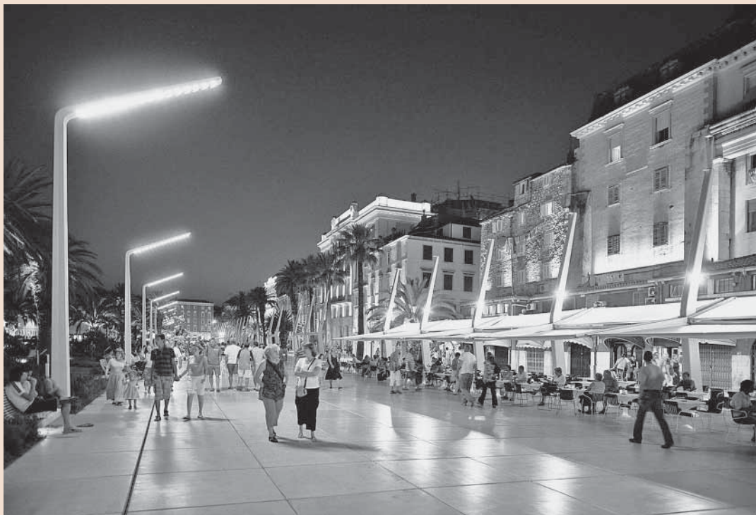
↑ Split, Riva, 2007., snimio: Domagoj Blažević