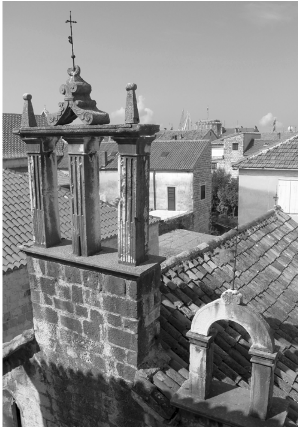
7. Preslice iznad pročelja crkve Svih svetih Bell gables above the front façade of the church of All Saints

a druga na lijevoj (sjevernoj) strani ponad krova. (sl. 7) Arhitektonski motiv preslice ima svoju poetiku i dugu povijest. Preslica je zapravo kameni okvir otvora u kojem vise zvona. Ujedno je i okvir koji omeđuje plohe neba. Sama zvona svojom zelenom bojom oksidirane bronce, s drvenom prečkom na kojima su obješena, s konopom ili lancem kojima se povlače, doimaju se poput akustičke i kinetičke instalacije (na preslicama crkvice Svih svetih, nažalost, više ne vise zvona). Preslice sa zabatom na vrhu nad pročeljima crkvice izgledaju poput pročelja malih zdanja postavljenih vrh većih. Zapravo, preslice su poput zida minijaturne crkve koja ima samo pročelje. U dalmatinskoj arhitekturi možemo pratiti mijene ovog motiva od srednjovjekovnih