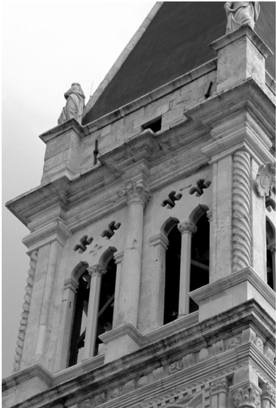
2. Treći kat zvonika katedrale; zapadna strana Third floor of the cathedral bell tower; west side

vilaqua u Veroni koja se prepoznaje kao djelo Michelea Sanmichelija. 14 No, u slučaju trećeg kata zvonika trogirске katedrale, ovi su ugaoni stupovi s izvijenim kanelurama fenomen stilske retardacije.