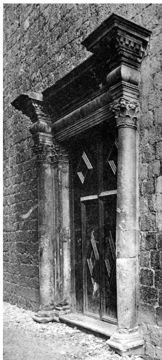
10. Portal crkve Sv. Mihovila

Oko grbova, onog ispod i onih uz lava sv. Marka, kartuše su s izvijenim krakovima. Grbovi kneza Francesca da Mosta, svaki u svojoj edikuli, jajolika su oblika,