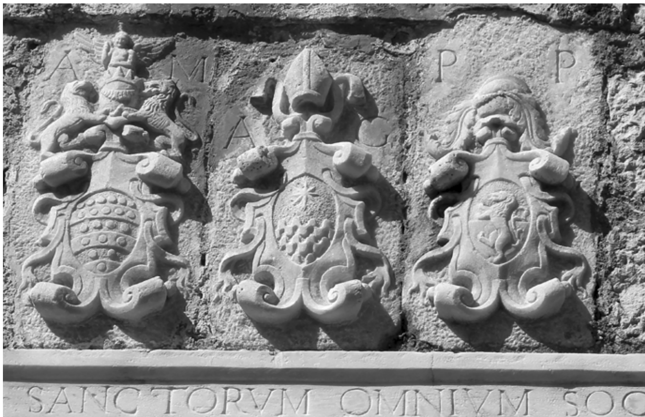
5. Grbovi na pročelju crkve Svih svetih, iznad natpisa iz 1588. godine

Coats of arms on the front façade of the church of All Saints, above an inscription from 1588