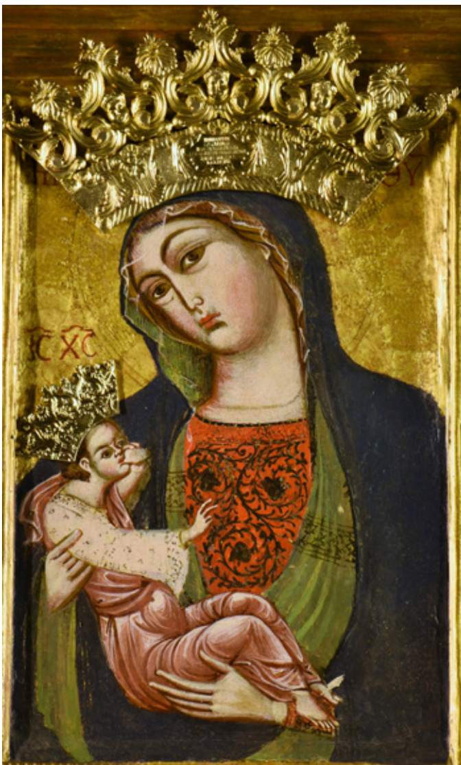
7. Središnji dio triptiha Majke Božje Trsatske, 1310. – 1330., crkva Majke Božje Trsatske, Rijeka

Central part of the triptych of Our Lady of Trsat, 1310-1330, church of Our Lady of Trsat, Rijeka