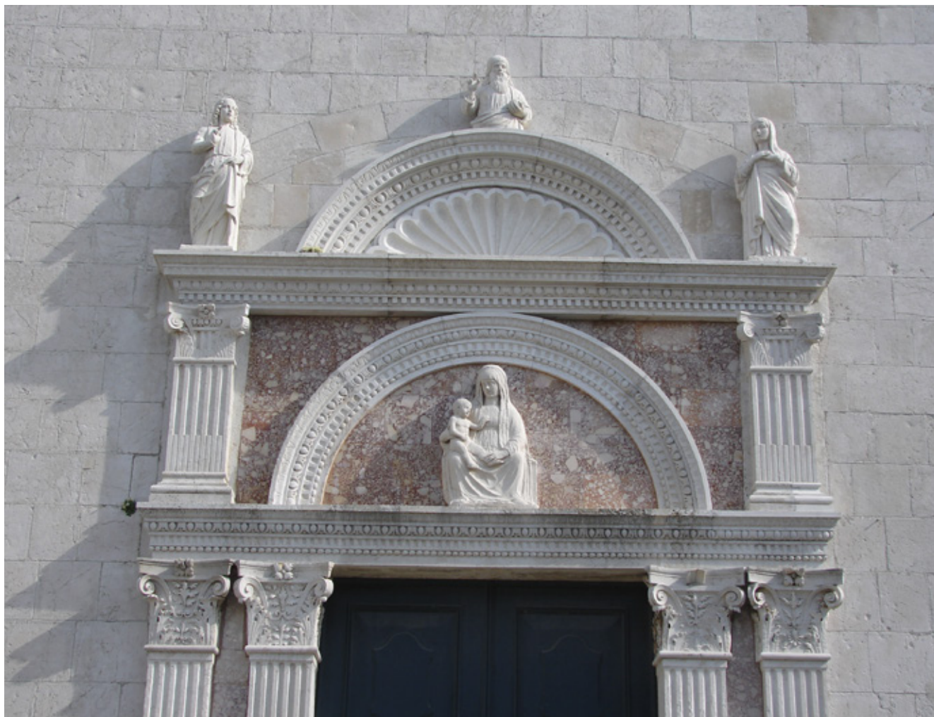
2. Portal osorske katedrale, kraj 15. stoljeća (foto: M. Pelc, Fototeka Instituta za povijest umjetnosti, D-019)

Portal of the Osor Cathedral, late 15 th century