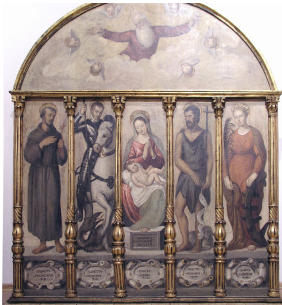
7. Arminio Zuccato, Bogorodica sa svetcima , tempera na dasci, 1570.

Arminio Zuccato, The Virgin with Saints , tempera on wood, 1570