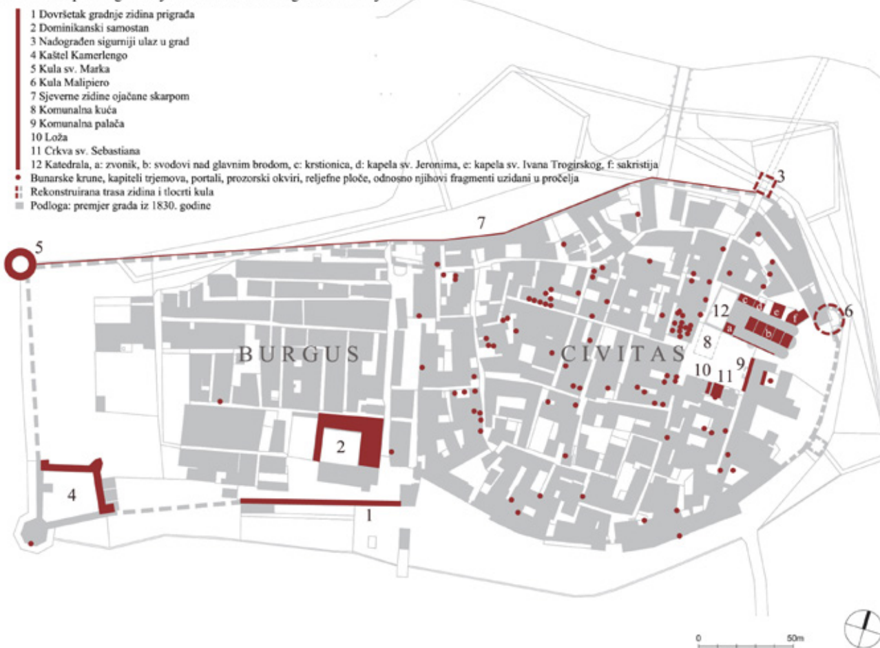
Shematski prikaz graditeljskih aktivnosti u Trogiru u 15. stoljeću

Schematic presentation of architectural activity in Trogir during the 15 th century