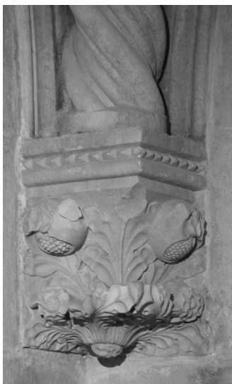
9. Katedrala, kapela Sv. Jeronima, kapitel

Bitno je, međutim, istaknuti da djelatnost navedenih majstora nije ostala ograničena samo i isključivo na katedralu. Te su iste majstore, te njihove učenike i sljedbenike, upošljavali i drugi naručitelji u gradu – ponajprije sami plemići za opremanje vlastitih rezidencijalnih zdanja, zatim bogati građani koji su se upravo u tom 15. stoljeću izdvojili kao zasebna grupa financijski sposobna investirati u propagandu vlastite važnosti i