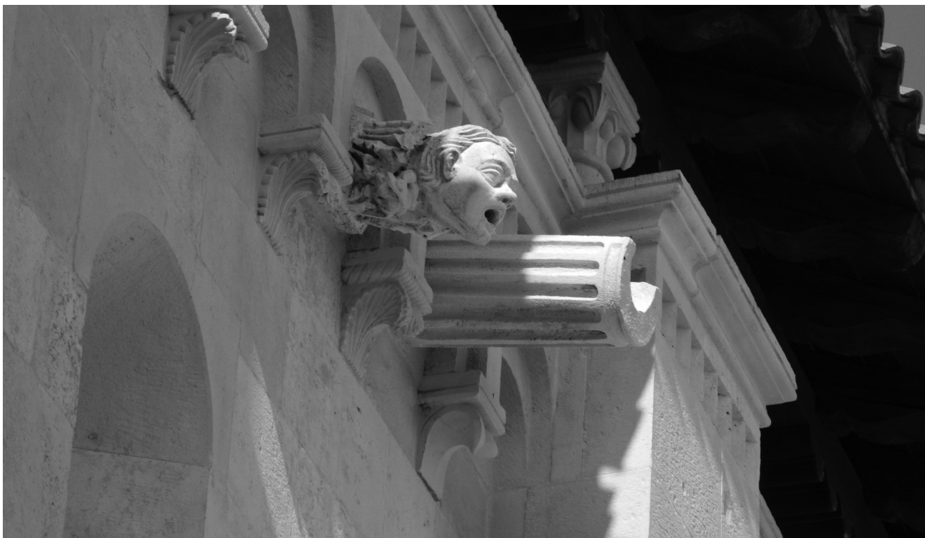
6. Katedrala, terasa nad južnim brodom i vodorige

Cathedral, terrace above the south aisle and the aquifers