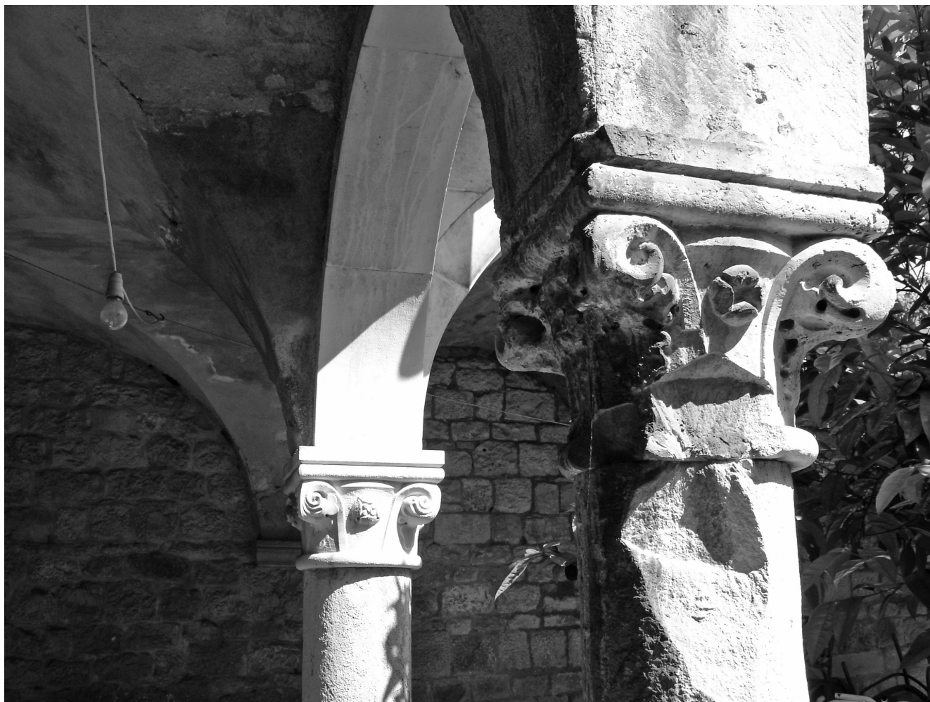
3. Dominikanski samostan, klaustar