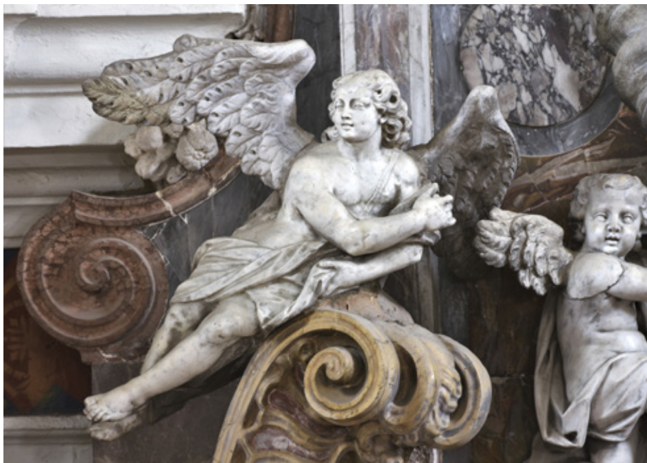
13. Orazio Bonetti, Andeli naatici glavnog oltara u Bribiru, župna crkva, Bribir

Kuda je Bonetti iz Rijeke mogao otići i zašto, zasad nije lako odgovoriti, no čini se da je s teritorija pod stijegom habsburškog orla prešao na onaj pod okriljem lava svetog Marka. Na put prema Dalmaciji majstor je najvjerojatnije krenuo preko kvarnerskih otoka gdje se, može se pretpostaviti, zadržao kraće vrijeme i napravio poneko dosad neprepoznato djelo. U malenom mjestu Orlecu na Cresu, na glavnom oltaru župne crkve Svetog Antuna opata, tri su mramorne skulpture od kojih središnja predstavlja titulara crkve između svetog Antuna Padovanskog i svetog Franje Asiškog (sl. 17). Ova tri mramorna lika bez sumnje se mogu prepoznati kao Bonettijevo djelo. Maleni ljupki Isus u naručju padovanskog svetca identičan je onomu kod salezijanki u San Vito al Tagliamento ili svojoj reljefnoj varijanti na stipesu oltara Gospe Karmelske u Pazinu. Sam se svetac po jednostavnoj i mekoj stilizaciji habita može usporediti s imenjekom naatici pazinskog oltara. Najvještije isklesani lik jest sveti Antun opat kod kojeg je Bonetti stilizirao habit sa škapularom, slično kao i kod kipova svete Tereze i svetog Šimuna Stocka u Pazinu. Iz dosad nepoznatog dokumenta otkriveno je ime altarista koji je izradio glavni oltar u Orlecu. Bio je to protomajstor Giuseppe Bisson porijeklom iz Venecije, a djelatan na Krku u trećoj četvrtini 18. stoljeća. 40 On je 1758. ugovorio podizanje dvaju manjih bočnih oltara, onaj svetog Antuna Padovanskog te svetog Jakova u trećoredskoj crkvi u Glavotoku, uz ukupnu