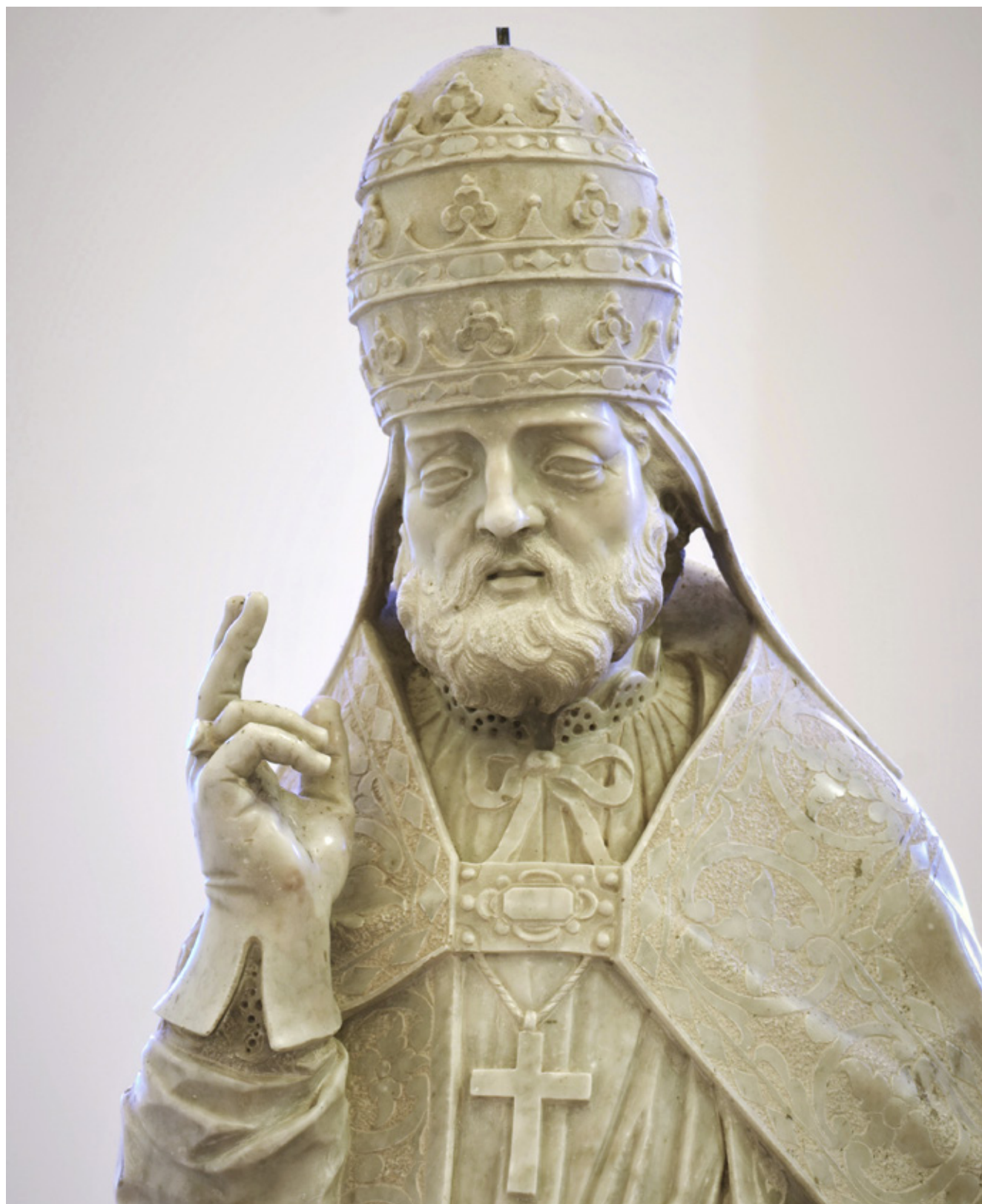
22. Orazio Bonetti, Sveti Silvestar , župna crkva, Lovreć pokraj Imotskog, detalj, (foto: D. Tulić) Orazio Bonetti, Saint Sylvester , parish church, Lovreć near Imotski, detail