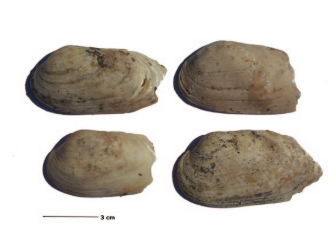
Sl. 1 Fragmentirane ljuštare školjkaša iz roda Unio

Razlozi za povremeno iskorištavanje ovog slatkovodnog prirodnog resursa leže i u kakvoći mesa. Hranjenje filtriranjem čini ove školjkaše odličnim čistačima voda, no utječe na miris i okus mesa, kao i zdravstvenu ispravnost (Bauer, Wächter 2001). Dok U. pictorum i U. tumidus obitavaju u stajaćim vodama, U. crassus uglavnom preferira vode tekućice zbog čega njihovo meso može imati ugodniji okus i miris (Gulyás et al. 2007). Skupljanje preferirane vrste školjaka može biti vidljivo i u taksonomskom sastavu. U. crassus najzastupljeniji je školjkaš u Iloku sa 31,43 %, dok U. pictorum i U. tumidus zaostaju sa 14,28 %, odnosno 11,43 %. Sličan obrazac vidljiv je i drugdje. Na lokalitetu Eceşfalva 23, također je najzastupljeniji U. crassus (54 %), za razliku od U. pictorum (37 %) i U. tumidus (9 %) (Gulyás et al. 2007). Slična situacija je i u Vinči – Belom