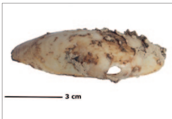
Sl. 2 Perforirana školjka – obična lisanka ( U. crassus )

Osim u prehrani, dokumentirano je korištenje ovih slatkovodnih školjkaša kao neutilitarnih predmeta. Märgärit (2016) opisuje ljuštare školjaka iz roda Unio s više eneolitičkih lokaliteta Gumelnița kulture u Rumunjskoj koje su bile obrađene kao ukrasi i oruđe. Na lokalitetu su pronađeni primjerci u različitim stadijima obrade, od jednostavno perforiranih ljuštura do gotovih perli. Na rumunjskom ranobrončanodobnom lokalitetu Šoimești pronađeno je mnoštvo raznovrsnih grobnih priloga, među kojima su i perle izrađene od Unio školjaka (Alin et al. 2020). Nekoliko primjeraka probušenih ljuštura pronađeno je na nalazištu Vinča – Belo brdo, kao i veći broj ljuštura koje su mogle služiti za struganje ili poliranje (Dimitrijević, Mitrović 2016). Nekoliko