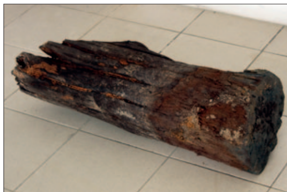
Sl. 1 Sačuvano deblo stupa

Nad ukopima ovih grobova ležale su dvije strukture mlađeg nastanka te su shodno tome uklonjene. Vjerojatno je riječ o postamentu za bazu bočnoga oltara iz kasnije faze. Možda se to dogodilo već na prijelazu iz 15. u 16. stoljeće kada je kapela značajno preuređena – zidovi su joj ojačani, dodana joj je obrambena cilindrična kula uz svetište te novi portal. Tom je prigodom i unutrašnjost kapele izmijenjena – u velikoj mjeri su otučeni polustupovi, a same baze ostale su ispod znatno podignute hodne površine, odnosno nove podnice od opeke (Belaj, Papić 2021: 518). U to isto, kasnije, doba sagrađen je – čini se – i trijumfalni luk. Njegovim zidanjem prekrivena je baza polustupa između drugog i trećeg traveja uz sjeverni zid, koja je ove godine otkrivena uklanjanjem ostataka navedene strukture (sl. 2). Baza je, iako zbog kasnijih pregradnji slabije sačuvana, identična paru baza pronađenih uz sjeverni i južni zid 2019. godine, sve su dekorirane ornamentom griffes 5 koji završava u