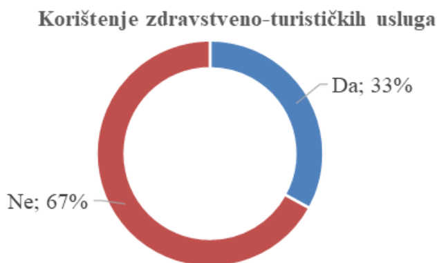
Grafikon 1. Jeste li ikada koristili zdravstveno-turističke usluge? (n=303)

životne dobi najčešće koriste zdravstveno-turističke usluge, a iza njih slijede osobe srednje životne dobi. Razlike u korištenju zdravstveno-turističkih usluga u odnosu na spol ispitanika ne postoje, odnosno podjednak broj muškaraca i žena koristi usluge ( p > 0,05 ).