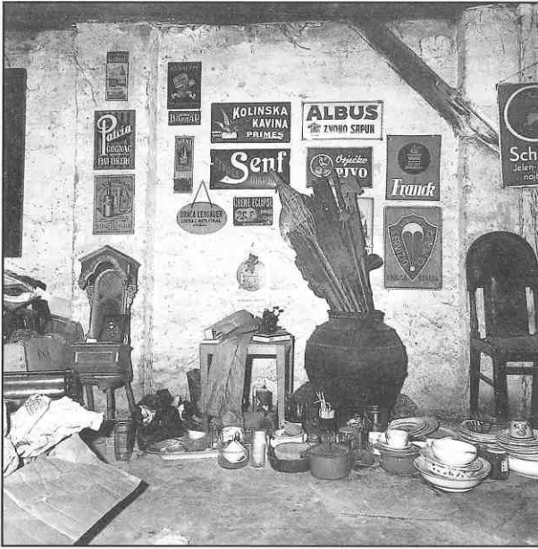
Antimuzej V. D. Trokuta

strane uredskog stola. Na njegovoj uglačanoj površini počivale su ruke neobična arhivara. Govorio bi o Francuskom prozoru u sklopu Galerije stanara, u kojemu su se događale neobične stvari, spominjao bi vezu između Duchampove nevjeste, crnog prozora i jednoga drugog prozora, na drugom mjestu, širom otvorenih kapaka koji su otkrivali perspektivu orlova. Pričao bi o Broodthaersovu filmu koji iluzijom slika iz oblasti orlova tjera iluziju zamišljena muzeja moderne umjetnosti, dosjetkama je obogaćivao legendu o Bomarzu, prisjećao se zanimljivih zdanja u Ulici Renéa Magrittea, priča koje je kupovao prilikom susreta s hrvatskim antimuzealcem, lubanje i labirinta koje je vidio u jednoj zemlji daleko na ... itd.