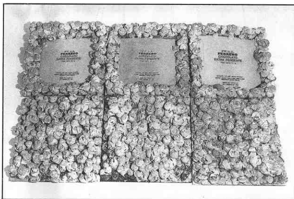
DUBRAVKA LOŠIĆ: Uspavanka

Već smo rekli da se odabir radova zasniva na detekciji zajedničkih ili bliskih formalnih i svjetonazorskih elemenata. Formalni bi se mogli svesti na sklonost upotrebi trošnih materijala, neuobičajenih formata, kompozicija bez čvrsta gravitacijskog središta, lapidarnoj obradi površine, specifičnim oblicima naracije te odustajanju od klasičnih medija slikarstva ili skulpture u korist instalacija i kombiniranih tehnika. Hotimice neizmjenjeni prirodni materijali (drvo, mahovina, voda) "dodaju" svoj značenjski potencijal semantičkom sloju djela, ali pridonose i njegovoj formalnoj krhkosti, odnosno konceptijskoj uvjerljivosti. Staza Mirjane Vodopije npr. – "zaprljano" platno, zategnuto preko okresanih grana čiju organsku liniju slijedi, smješteno unutar prevelikog okvira od grubo obrađena drveta, ispunjeno nizom linearnih, vrlo osobnih ideograma - jedan je od nekoliko radova smještenih na pola puta