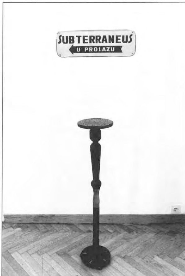
Željko Kipke: U znaku bolesnog Marsa - subterraneus u prolazu (NSU)