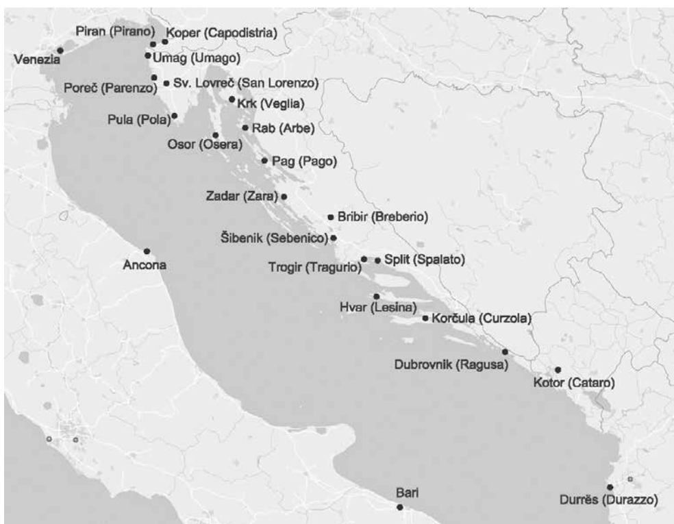
Slika 1. Karta Jadrana (izradila Ivana Haničar Buljan)

Utjecaj nove (mletačke) uprave i posljedične mobilnosti bio je vrlo važan za razvoj gradova, pa je ignoriranje (ili neuočavanje) različitih razina prisutnosti središnjih vlasti na istočnom Jadranu također pogrešno, a često je posljedica individualnoga istraživanja gradova na temelju (prvenstveno) lokalnih arhiva i samo unutar nacionalnih granica. Tako primjerice ne treba zanemariti veliki utjecaj Venecije na oblikovanje istočnojadranskih gradova znatno prije 15. stoljeća, bez obzira na izvršnu razinu vlasti, a on je recentnije i postao interes istraživača. Radovi hrvatske historiografije s kraja 20. i početka 21. stoljeća koji prostor istočnoga Jadrana istražuju znatno komparativnije temelj su za istraživanje. Osobito najsvježiji radovi pokazuju veće zanimanje domaće historiografije za istraživanje arhiva u Veneciji, Budimu ili Rimu, uz proučavanje međunarodne literature, čime se stavlja naglasak na poredbeni aspekt te istraživanjima prilazi mnogo složenije. I međunarodne studije na koje se ovaj tekst oslanja pokazuju da postoji veliki potencijal za komparativni pristup i složenije raščlambe pitanja vezanih uz središnje vlasti i sfere moći.