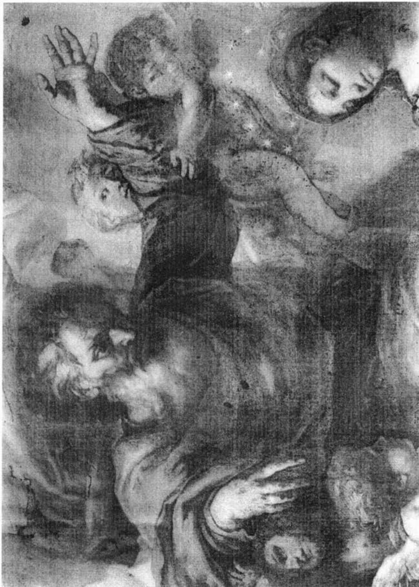
Sl. 4. Carlo Maratti (?), Pala Bezgrješnog začeca u crkvi Male braće u Dubrovniku, detalj