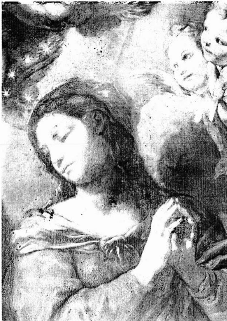
Sl. 5. Carlo Maratti (?), Pala Bezgrješnog začeca u crkvi Male braće u Dubrovniku, detalj