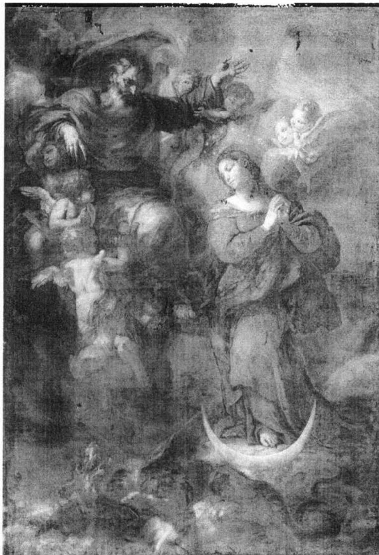
Sl. 2. Carlo Maratti (?), Pala Bezgrješnog začeća u crkvi Male braće u Dubrovniku