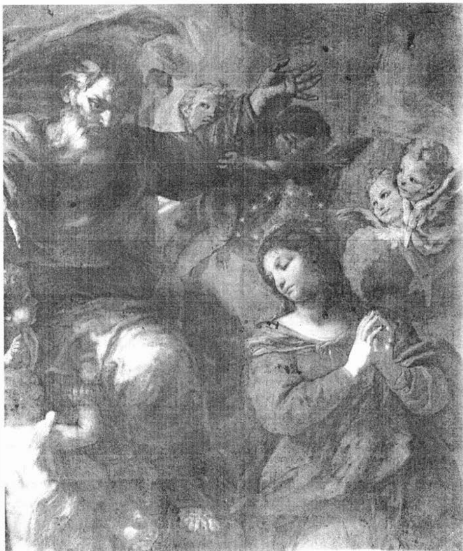
Sl. 3. Carlo Maratti (?), Pala Bezgrješnog začeća u crkvi Male braće u Dubrovniku, detalj