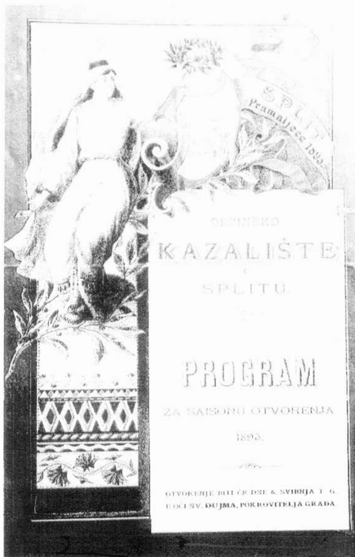
Sl. 2. Program svečanog otvaranja Općinskog kazališta u Splitu 1893. god.