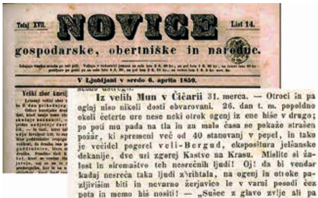
Slika 3. Novinska vijest iz 1859. o velikom požaru u Velom Brgudu Figure 3. Newspaper news from 1859 about the great fire in Veli Brgud

Požar je izazvalo dijete kojem je ispao žar koji je nosilo iz jedne kuće u drugu. U arhivima nisu pronađeni detalji o tome koje su kuće u pitanju i kako se požar širio.