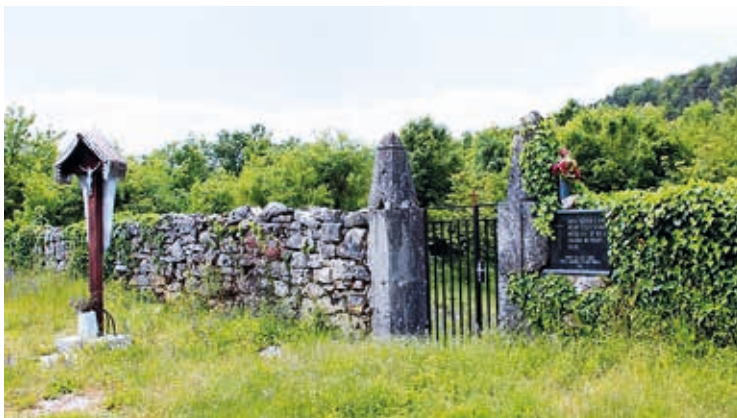
Slika 1. Crkveni dolac, privremeno groblje u doba kolere

Zbog velikog broja umrlih postojeće groblje postalo je pretijesno te je dio umrlih osoba pokopan oko 150 metara dalje od groblja, na njivi zvanj Crikveni dolac.