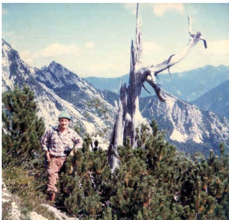
Slika 5. Marijan Rubeša u slovenskim Alpama.

Treba pribilježiti i sudjelovanje grupe planinara Društva na „sedmom ‘Pohodu planinara Jugoslavije’ na Titov vrh u povodu Dana mladosti“ (Rubeša 1986c).