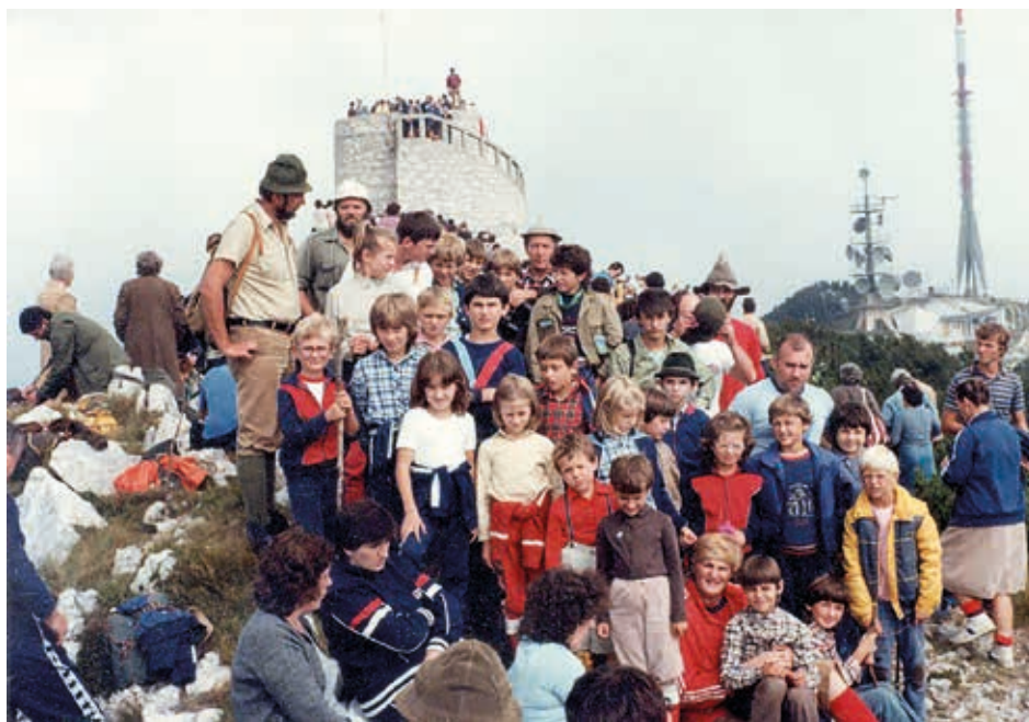
Slika 2. Članovi Planinarskoga društva „Orljak“ na Vojaku, 9. rujna 1984.

O aktivnosti Aktiva svjedoči i masovnost, koju je brzo postigao djelujući, kako je spomenuto, u nekim drugim, možda i novijim smjerovima razvijanja planinarstva. To razilaženje u viziji daljnjega razvoja prirodno je dovelo do ideje da se aktiv treba osamostaliti i osnovati kao zasebno planinarsko društvo, što će se i dogoditi 1984. godine.