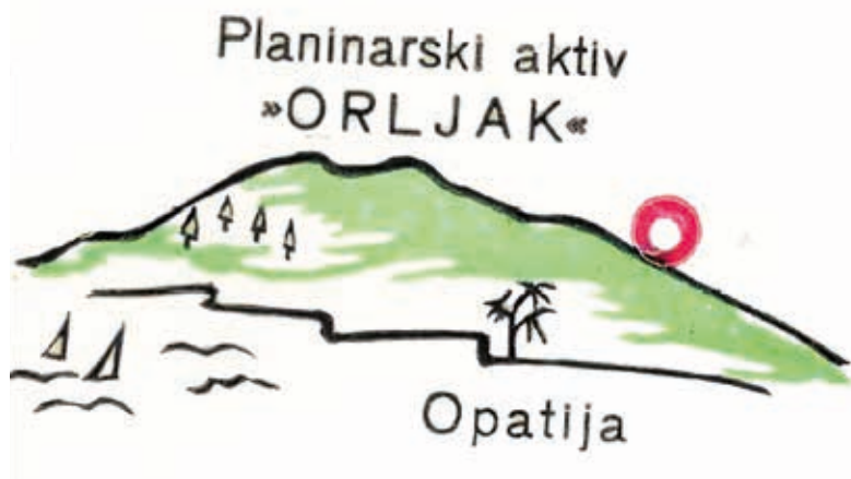
Slika 1. Znak Planinarskoga aktiva „Orljak“.

Snaga Aktiva vidljiva je i na temelju jednoga od spomenutih dopisa Planinarskom savezu Hrvatske, gdje je osim transverzala bilo traženo i 10 značaka Saveza, raspitalo se o literaturi radi obuke članstva u orijentaciji i topografiji te se molila potvrda primitka pretplate na časopis Naše planine (HPS Rubeša 1983a), što govori u prilog tomu da je Aktiv već pomalo prerastao svoje okvire djelujući gotovo samostalno. Da je bio ozbiljno organiziran, svjedoči i činjenica da je imao vlastiti znak, odnosno žig: konture grebena planine Učke sa stilizacijom stabala/šume podno grebena; na desnoj gornjoj strani markacija, a ispod more s dvije stilizirane jedrilice i dva stilizirana galeba; iznad grebena piše Planinarski aktiv „Orljak“ , a ispod Opatija .