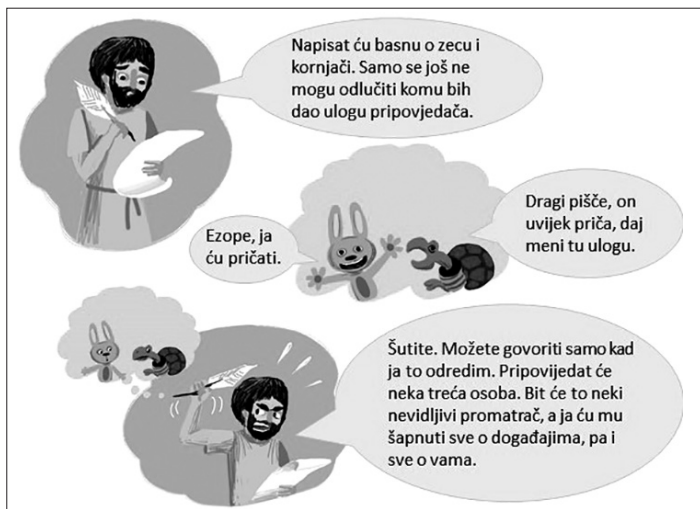
SLIKA 3. Lingvometodički predložak za prvi zadatak podcrtavanja predikata

Učitelj odabire jednu od izrečenih rečenica i zapisuje je. Poziva učenike da odrede predikatne kategorije zapisanom predikatu, npr. moguće je zapisati rečenicu Dječak je skočio . Predikatne kategorije su: 3. osoba, broj je jednina, vid je svršeni, vrijeme je perfekt, a način indikativ. Učenici uočavaju da su predikatne kategorije gramatička svojstva predikata kojima predikat upravlja ostalim članovima rečenice. Potom učitelj najavljuje čitanje stripa o Ezopu koji prikazuje na slikokazu.