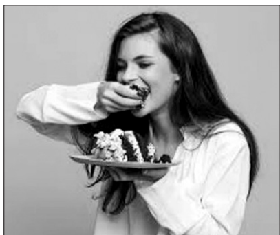
SLIKA 1. Fotografija za stvaranje rečenice u motivacijskom dijelu sata

Učenici će opisati fotografiju rečenicom Djevojka jede tortu rukama . Učitelj razgovara s učenicima o mogućem poretku riječi u ovoj rečenici, a učenici uočavaju da je u hrvatskom jeziku slobodniji poredak riječi i da, ako zamijenimo mjesta pojedinim rečeničnim dijelovima, obavijest je svejedno razumljiva. Učitelj pitanjima navodi učenike na razmišljanja o pravilnom poretku riječi u rečenici npr. Zašto je riječ djevojka na prvom mjestu? Koju službu ima ta riječ u rečenici? Koju službu imaju ostale riječi? Učitelj naglašava da pravilan poredak riječi u rečenici usvajamo pomoću gramatičkoga