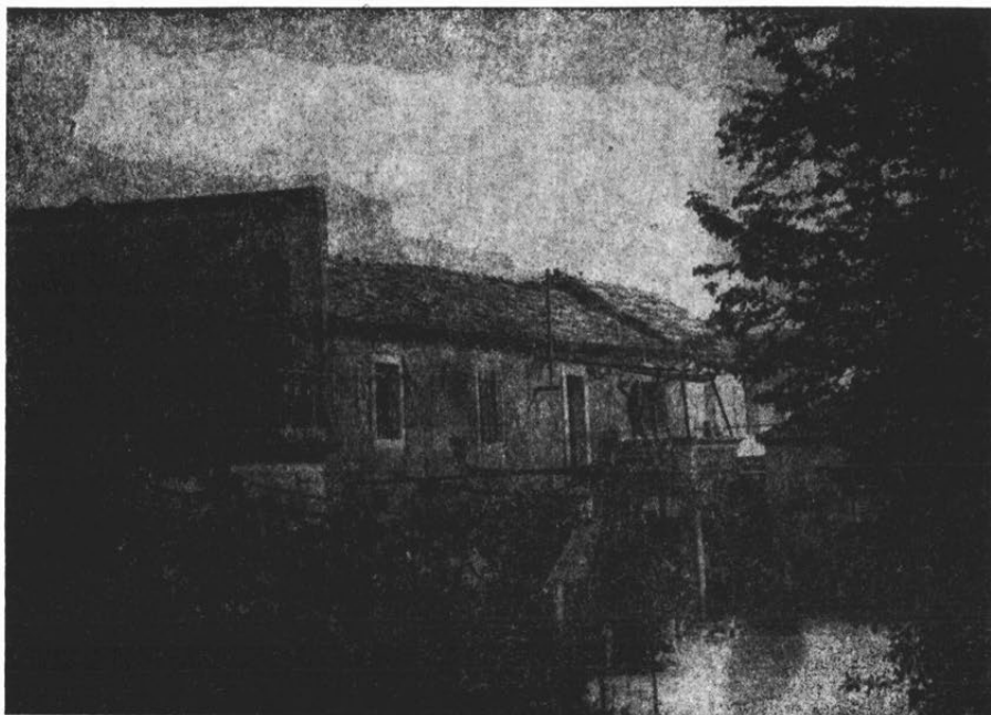
Kuća Smiljanića u Zemuniku