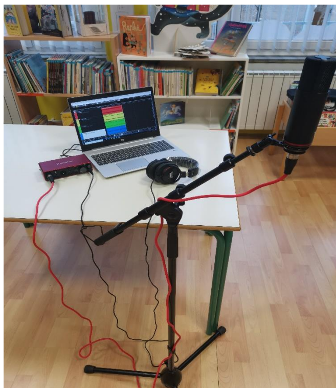
Slika 2: - Računalo, zvučna kartica, slušalice, širokokutni mikrofona na stalku