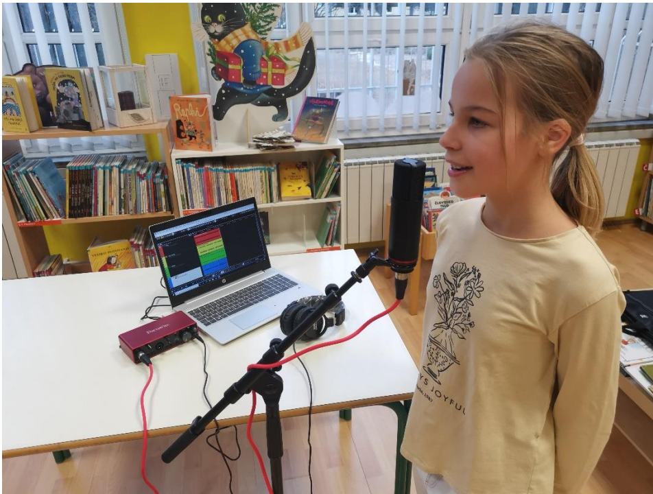
Slika 3: – Prikaz udaljenosti snimatelja od mikrofona