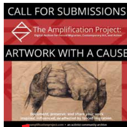
Grafika i dizajn: Lilli Muller, 2020.