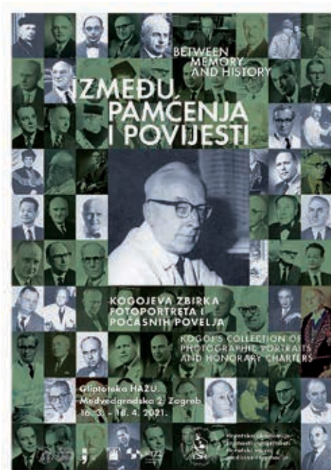
Slika 4. Plakat izložbe