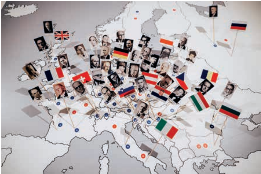
Slika 3. Prikaz Kogojeve dermatološke društvene mreže na karti Europe