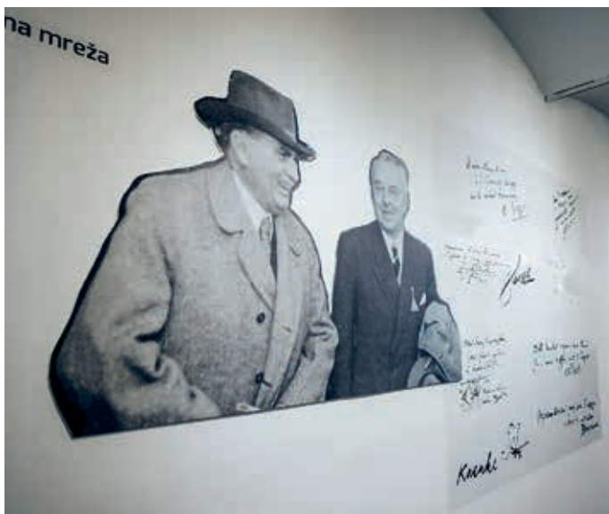
Slika 1. Pogled na dio izložbe posvećen Kogojevoj dermatološkoj društvenoj mreži