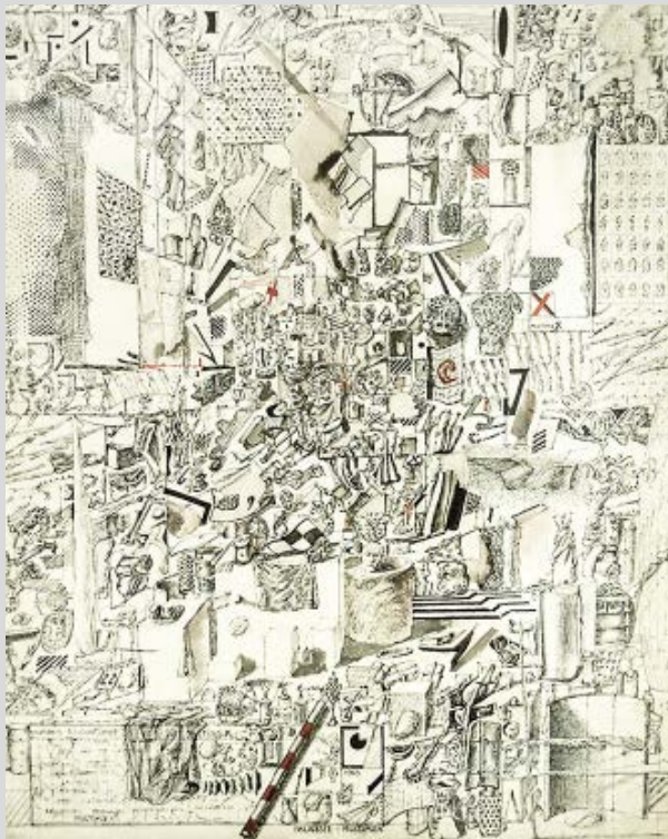
Leonid Šejka, Skladište Multipleks [Multiplex Warehouse], 1965., tuš, akvarel / ink drawing, watercolor. (Soba Leonida Šejke, kolekcija Nenada Erića, katalog izložbe. Beograd: Fondacija Plavo, 2017./ Soba Leonida Šejke , the collection of Nenad Erić, exhibition catalogue. Belgrade: Fondacija Plavo, 2017)